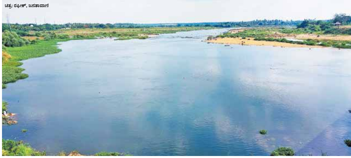
ತುಂಗಭದ್ರಾ ಕಳೆದ ಕೆಲ ದಿನಗಳಿಂದ ಉತ್ತಮ ಮಳೆಯಾಗುತ್ತಿರುವುದರಿಂದ ಹರಿಹರ ಬಳಿಯ ತುಂಗಭದ್ರಾ ನದಿಗೆ ನೀರು ಹರಿದು ಬರಲಾರಂಭಿಸಿದೆ. ಬರದ ಹಿನ್ನೆಲೆಯಲ್ಲಿ ನದಿ ಬಹುತೇಕ ಬತ್ತಿ ಹೋಗಿತ್ತು.