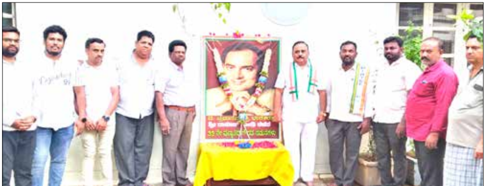
ರಾಜೀವ್ ಗಾಂಧಿ 33ನೇ ಪುಣ್ಯದಿನ - ರಾಷ್ಟ್ರೀಯ ಭಯೋತ್ಪಾದನಾ ವಿರೋಧಿ ದಿನ ಕಾರ್ಯಕ್ರಮದಲ್ಲಿ ಕೆಪಿಸಿಸಿ ಪ್ರಧಾನ ಕಾರ್ಯದರ್ಶಿ ಡಿ. ಬಸವರಾಜ್

ದಾವಣಗೆರೆ, ಮೇ 21 - ಸಾಮಾನ್ಯನ ಕೈಯಲ್ಲಿ ಮೊಬೈಲ್ ಫೋನ್ ಬರಲು ಮಾಡಿ ಪ್ರಧಾನ ಮಂತ್ರಿ ರಾಜೀವ್ ಗಾಂಧಿ ಕಾರಣರಾಗಿದ್ದಾರೆಂದು ಕೆಪಿಸಿಸಿ ಪ್ರಧಾನ ಕಾರ್ಯದರ್ಶಿ ಡಿ. ಬಸವರಾಜ್ ಹೇಳಿದರು. ನಗರದ ಜಿಲ್ಲಾ ಕಾಂಗ್ರೆಸ್ ಸಮಿತಿಯ ಇಂಟರ್ ವಿಭಾಗವು ಏರ್ಪಡಿಸಿದ್ದ ಮಾಜಿ ಪ್ರಧಾನ ಮಂತ್ರಿ ಭಾರತ ರತ್ನ ರಾಜೀವ್ ಗಾಂಧಿ ಅವರ 33ನೇ ಪುಣ್ಯದಿನವನ್ನು ರಾಷ್ಟ್ರೀಯ ಭಯೋತ್ಪಾದನಾ ವಿರೋಧಿ ದಿನವನ್ನಾಗಿ ಆಚರಿಸಲು ಪ್ರಯತ್ನ ಕಾರ್ಯಕ್ರಮದಲ್ಲಿ ಪಾಲ್ಗೊಂಡು, ರಾಜೀವ್ ಗಾಂಧಿ ಭಾವಚಿತ್ರಕ್ಕೆ ಪುಷ್ಪ ನಮನ ಸಲ್ಲಿಸಿ, ಗೌರವ ಅರ್ಪಿಸಿ ಅವರ ಮಾತನಾಡಿದರು. ರಾಜೀವ್ ಗಾಂಧಿ ಅವರು ಅತಿ ಕಿರಿಯ ವಯಸ್ಸಿಗೆ ವಿಶ್ವದಲ್ಲೇ ದೊಡ್ಡ ಪ್ರಜಾಪ್ರಭುತ್ವ ಹೊಂದಿರುವ ಭಾರತ ದೇಶದ ಪ್ರಧಾನ ಮಂತ್ರಿಯಾಗಿ ಅಧಿಕಾರದ ಚುಕ್ಕಾಣಿ ಹಿಡಿದು ಐದು ವರುಷಗಳ ಕಾಲ ದೇಶಕ್ಕೆ ಉತ್ತಮ ಆಡಳಿತ ನೀಡಿದ್ದರು. ತಮ್ಮ ಅಧಿಕಾರದ ಅವಧಿಯಲ್ಲಿ ಅವರು ಭಾರತ ದೇಶವನ್ನು ಜಗತ್ತಿನ ಶಕ್ತಿಶಾಲಿ ರಾಷ್ಟ್ರವನ್ನಾಗಿ ಮಾಡಿದ್ದರು ಎಂದವರು ಹೇಳಿದರು. ಭಾರತ ದೇಶಕ್ಕೆ ಹೊಸ ಶಿಕ್ಷಣ ನೀತಿ ಜಾರಿಗೊಳಿಸಿದ್ದರು. ಇಡೀ ಪ್ರಪಂಚ ಭಾರತ ದೇಶದ ಕಡೆ ತಿರುಗಿ ನೋಡುವಂತೆ ಮಾಡಿದ್ದರು. ಭಾರತ ದೇಶ ಕಂಡ ಅಪ್ರತಿಮ ನಾಯಕ ರಾಜೀವ್ ಗಾಂಧಿ ಅವರು ಅಲ್ಪ ಸಮಯದಲ್ಲಿ ದೇಶದ ಅಭಿವೃದ್ಧಿಯ ಮೂಲಕ ಧ್ರುವತಾರೆಯಾಗಿ ಮಿಂಚಿದ್ದರು ಎಂದು ಬಸವರಾಜ್ ಬಣ್ಣಿಸಿದರು. 18 ವರ್ಷದ ಯುವ ಸಮೂಹಕ್ಕೆ ಮತದಾನದ ಹಕ್ಕನ್ನು ನೀಡಿದ್ದರು. ಮಾಹಿತಿ ತಂತ್ರಜ್ಞಾನದ ಅಭಿವೃದ್ಧಿಯ ಕನಸು