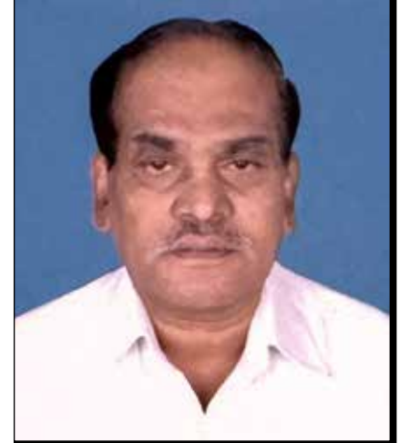
ದಾವಣಗೆರೆ ಸಿಟಿ ವಿನ್ಯಾಸ ನಗರ ವಾಸಿ, ನಿವೃತ್ತ ಎಕ್ಸಿಕ್ಯೂಟಿವ್ ಇಂಜಿನಿಯರ್