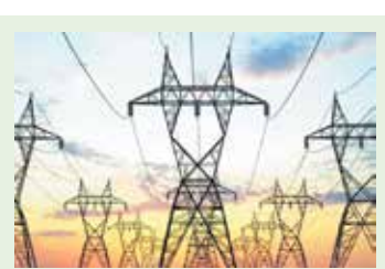
ಕಳೆದ ಎರಡು ತಿಂಗಳು ಬೇಡಿಕೆ ಪ್ರಮಾಣ ಪೂರೈಸಲು ಸಾಧ್ಯವಾಗದ ಸ್ಥಿತಿ ನಿರ್ಮಾಣವಾಗಿತ್ತು. ಆದರೆ ಈ ತಿಂಗಳು ಕೃಷಿ ಪಂಪ್‌ಹೌಸ್ ಮತ್ತು ಗೃಹ ಬಳಕೆ ವಿದ್ಯುತ್ ಬೇಡಿಕೆ ಪ್ರಮಾಣದಲ್ಲಿ ಸುಮಾರು 3,000 ಮೆಗಾವ್ಯಾಟ್‌ಗಳಷ್ಟು ಕುಸಿತ ಕಂಡಿದೆ.

ಬೆಂಗಳೂರು, ಮೇ 21 - ಕಳೆದ ಕೆಲವು ದಿನಗಳಿಂದ ರಾಜ್ಯದಲ್ಲಿ ಸುರಿಯುತ್ತಿರುವ ಮಳೆಯಿಂದ ವಿದ್ಯುತ್ ಅಭಾವ ನೀಗಿದೆ. ಮುಂಗಾರು ಮತ್ತು ಹಿಂಗಾರು ಮಳೆ ಕೈಕೊಟ್ಟಿದ್ದರಿಂದ ರಾಜ್ಯದಲ್ಲಿ ವಿದ್ಯುತ್ ಬೇಡಿಕೆ ಅಗಾಧವಾಗಿ ಹೆಚ್ಚಿತ್ತು. ಗೃಹಬಿಲ್ಡಿಂಗ್ ಯೋಜನೆ ಅನುಷ್ಠಾನ ಹಾಗೂ ಮಳೆ ಅಭಾವದಿಂದ ರಾಜ್ಯದಲ್ಲಿ 17 ಸಾವಿರ ಮೆಗಾವ್ಯಾಟ್‌ವರೆಗೂ ಬೇಡಿಕೆ ಹೆಚ್ಚಿ ದಾಖಲೆ ಸ್ಥಾಪಿಸಿತ್ತು. ಲೋಕಸಭಾ ಚುನಾವಣಾ ಸಂದರ್ಭದಲ್ಲಿ ಅಗಾಧ ವಿದ್ಯುತ್ ಬೇಡಿಕೆ ರಾಜ್ಯ ಸರ್ಕಾರವನ್ನು ಇಕ್ಕಟ್ಟಿಗೆ ಸಿಲುಕಿಸಿತ್ತು. ಈ ಸಂದರ್ಭದಲ್ಲಿ ಬೇಡಿಕೆ ಈಡೇರಿಸದಿದ್ದರೆ, ಆಡಳಿತಾರೂಢ ಕಾಂಗ್ರೆಸ್‌ಗೆ ಹಿನ್ನೆಲೆ ಉಣಕಾ ಗುತ್ತಿತ್ತು, ಇದನ್ನು ತಪ್ಪಿಸಲು ಮತ್ತು ಬೇಡಿಕೆ ಸಂದಿಗ್ಧತೆಯನ್ನು ವಿದ್ಯುತ್ ಹೆಚ್ಚು ಉತ್ಪಾದಿಸುವ ರಾಜ್ಯಗಳಿಂದ ಖರೀದಿಗೆ ಮುಂದಾಯಿತು. ಭತ್ತೀಸಾಫಡ, ತಮಿಳುನಾಡು, ಆಂಧ್ರಪ್ರದೇಶ ಸೇರಿದಂತೆ ವಿವಿಧ ರಾಜ್ಯಗಳಿಂದ ಗಣನೀಯ ಪ್ರಮಾಣದಲ್ಲಿ ರಾಜ್ಯ ಸರ್ಕಾರ ವಿದ್ಯುತ್ ಖರೀದಿ ಮಾಡಿತು. ಇಷ್ಟಾದರೂ ಮೇ, ಜೂನ್ ಪರಿಸ್ಥಿತಿ ನಿಭಾಯಿಸಲಾಗದ ಕಷ್ಟಕ್ಕೆ ಸಿಲುಕಿತ್ತು.