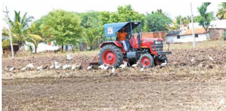
ದಾವಣಗೆರೆ ಸಮೀಪ ಜಮೀನೊಂದರಲ್ಲಿ ಟ್ರ್ಯಾಕ್ಟರ್‌ನಿಂದ ಉಳುಮೆ ಮಾಡುತ್ತಿರುವ ರೈತ

ದಾವಣಗೆರೆ: ಕಳೆದ ಕೆಲ ದಿನಗಳಿಂದ ಜಿಲ್ಲೆಯಲ್ಲಿ ಸುರಿಯುತ್ತಿರುವ ಮುಂಗಾರು ಪೂರ್ವ ಮಳೆ ಅನ್ನದಾತನಲ್ಲಿ ಹರ್ಷ ಮೂಡಿಸಿದೆ. ಹಿಂದಿನ ಮುಂಗಾರು ಹಂಗಾಮಿನಲ್ಲಿ ಜಿಲ್ಲೆಯಲ್ಲಿ ನಿಗದಿತ ಬಿತ್ತನೆ ಗುರಿ ಪೂರ್ಣಗೊಂಡಿದ್ದರೂ, ವಾಡಿಕೆಯಷ್ಟು ಮಳೆ ಸುರಿಯದೆ ಬರ ಆವರಿಸಿಕೊಂಡಿತ್ತು. ಈ ಹಿನ್ನೆಲೆಯಲ್ಲಿ ದಾವಣಗೆರೆ ಜಿಲ್ಲೆ 'ಬರಪೀಡಿತ'ವಾಗಿತ್ತು. ಬಿತ್ತನೆ ಬೆಳೆದಿದ್ದ ಪಸಲು ಕಣ್ಣೆದುರಿಗೇ ಒಣಗಿ ತೀವ್ರ ಸಂಕಷ್ಟದಲ್ಲಿದ್ದ ರೈತರಿಗೆ ಮುಂಗಾರು ಆಶಾಕಿರಣ ಮೂಡಿಸಿದೆ. ಈ ವರ್ಷದ ಮುಂಗಾರು ಉತ್ತಮವಾಗಲಿವೆ ಎಂಬ ಆಶಾಭಾವನೆಯಿಂದಲೇ ಕೃಷಿ ಕಾರ್ಯಗಳ ತಯಾರಿಯಲ್ಲಿದ್ದಾರೆ. ಬಿತ್ತನೆಗೆ ಭೂಮಿ ಹದಗೊಳಿಸುವ ಕಾರ್ಯ ಅಲ್ಲಲ್ಲಿ ನಡೆಯುತ್ತಿದೆ. ಬೀಜ, ಗೊಬ್ಬರದ ಲೆಕ್ಕಾಚಾರಗಳೂ ನಡೆಯುತ್ತಿವೆ.