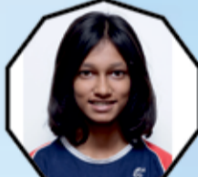
SKANDANA C K 417 - 83.4%