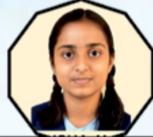
DISHA H S 441-88.2%