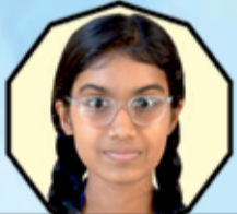
HEMA G S 483-96.6%