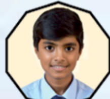
GAYAN R H 435-87%