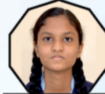
NAINIKA B 456-91.2%