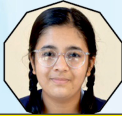
KHUSHI V 492-98.4%