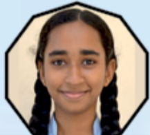
PAAVANA N 439-87.8%