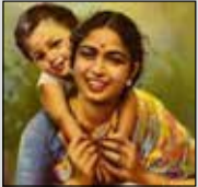
ಇಂದು ವಿಶ್ವ ತಾಯಂದಿರ ದಿನ