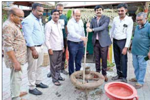
ಹೊಂಪದ ರಸ್ತೆ, ಚಾಲಿನಗರದ ಜನತಾ ವಿದ್ಯಾಲಯ ಇಂಗ್ಲಿಷ್ ಮೀಡಿಯಂ ಸ್ಕೂಲ್‌ನಲ್ಲಿ ಸಾಂಪ್ರದಾಯಿಕ ಮತಗಟ್ಟೆ