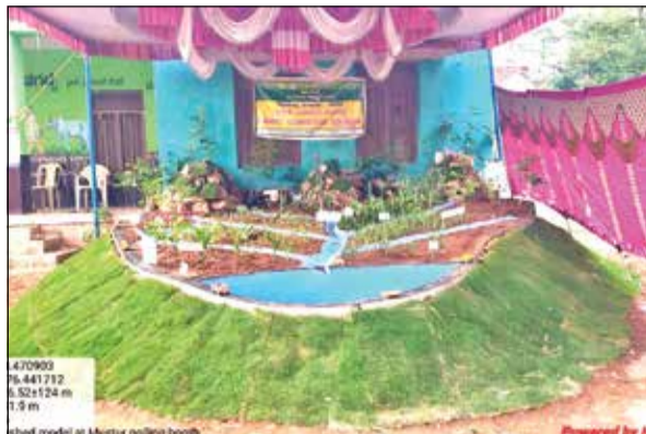
ಬೆಂಗಳೂರು ತಾಲ್ಲೂಕಿನ ಮುಸ್ಲಿಂನಲ್ಲಿ ಮಳೆ ನೀರು ಸಂರಕ್ಷಣೆ ಮಾಹಿತಿ ಮತ್ತು ಮತಗಟ್ಟೆ