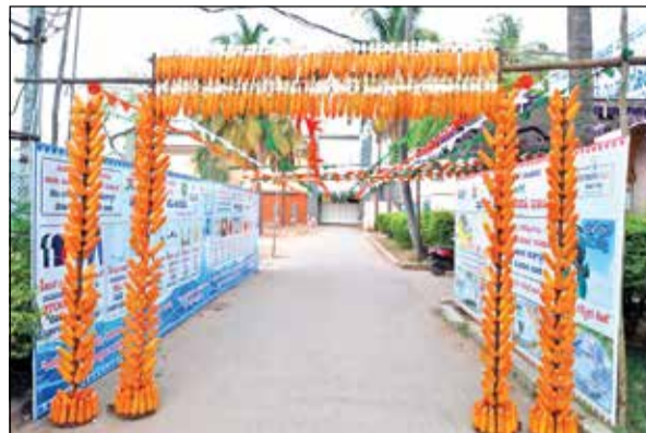
ಜಯದೇವ ಹಾಸ್ಪಿಟಲ್‌ನಲ್ಲಿ ಮೆಕ್ಲೋಕ್ ಸ್ಥಾಪನೆ ಕಮಾನು ನಿರ್ಮಾಣ