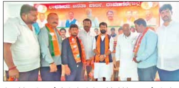
ದಾವಣಗೆರೆ, ಮೇ 5 - ಬಸವಾಪಟ್ಟಣ ವ್ಯಾಪ್ತಿಯಲ್ಲಿ ಕಾಂಗ್ರೆಸ್ ತೊರೆದು ಬಿಜೆಪಿಗೆ ಸೇರ್ಪಡೆಗೊಂಡರು.