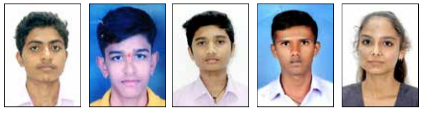
ದಾವಣಗೆರೆ, ಏ. 10- ದ್ವಿತೀಯ ಪಿಯು ಪರೀಕ್ಷೆಯಲ್ಲಿ ನಗರದ ಸೈನ್ಸ್ ಅಕಾಡೆಮಿ ಪದವಿ ಪೂರ್ವ ಕಾಲೇಜಿಗೆ ಶೇ. 98 ರಷ್ಟು ಫಲಿತಾಂಶ ಲಭಿಸಿದೆ.

119 ಅತ್ಯುತ್ತಮ ಶ್ರೇಣಿಯಲ್ಲಿ 172 ವಿದ್ಯಾರ್ಥಿಗಳು ಪ್ರಥಮ ಶ್ರೇಣಿಯಲ್ಲಿ ಉತ್ತೀರ್ಣರಾಗಿದ್ದಾರೆ. ಕನ್ನಡ ಭಾಷಾ ವಿಷಯದಲ್ಲಿ ಏಳು, ಗಣಿತದಲ್ಲಿ ಏಳು, ಜೀವಶಾಸ್ತ್ರದಲ್ಲಿ ನಾಲ್ಕು ವಿದ್ಯಾರ್ಥಿಗಳು ನೂರಕ್ಕೆ ನೂರು ಅಂಕ ಗಳಿಸಿದ್ದಾರೆ.