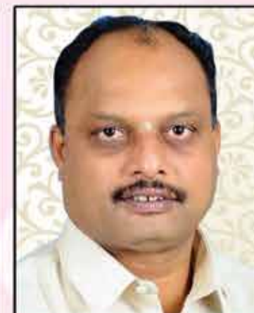
ಕುರುಡಿ ಗಿರೀಶ್ ಕ್ರೀಡಾ ಪ್ರೋತ್ಸಾಹಕರು