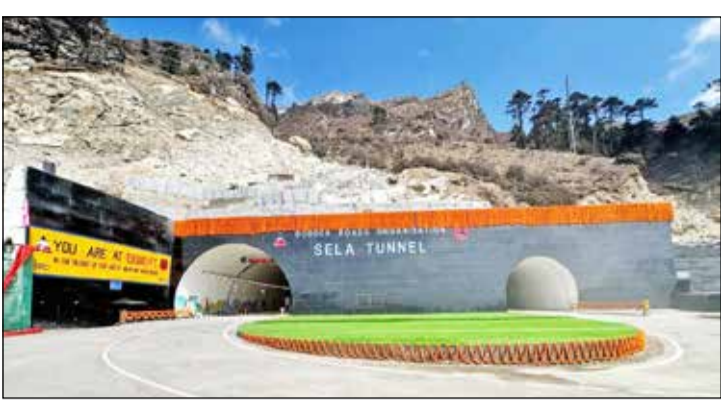
ಸಂಪರ್ಕ ರಸ್ತೆಗಳಿವೆ. ತುರ್ತು ಸಂದರ್ಭದಲ್ಲಿ ಜನರು ಹಾಗೂ ವಾಹನಗಳನ್ನು ತೆರವುಗೊಳಿಸಲು ಎರಡನೇ ಸುರಂಗವನ್ನು ಬಳಸಿಕೊಳ್ಳಲು ಅವಕಾಶವಿದೆ.

ವಿಶ್ವದ ಅತಿ ಉದ್ದನೆಯ ಅವಳಿ ಸುರಂಗ ಸೆಲಾ ಉದ್ಘಾಟನೆ ಅರುಣಾಚಲ ಪ್ರದೇಶದ 13 ಸಾವಿರ ಅಡಿ ಎತ್ತರದ ಸುರಂಗ ಮಾರ್ಗದಿಂದ ಗಡಿ ರಕ್ಷಣೆಗೆ ನೆರವು ಗುನಾಹತಿ, ಮಾರ್ಚ್ 9 - ವಿಶ್ವದ ಅತಿ ಉದ್ದನೆಯ ಅವಳಿ ಸುರಂಗ ಮಾರ್ಗವಾದ ಸೆಲಾ ಅನ್ನು ಪ್ರಧಾನ ಮಂತ್ರಿ ನರೇಂದ್ರ ಮೋದಿ ಉದ್ಘಾಟಿಸಿದ್ದಾರೆ.