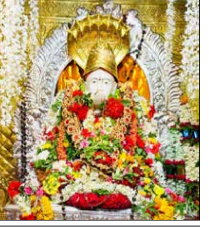
ಇಂದಿನಿಂದ ಒಂದು ವಾರ ಜಾತ್ರೆ, ನಾಳೆ ರಥೋತ್ಸವ

ದಕ್ಷಿಣ ಭಾರತದ ಕಾಶಿ ಕ್ಷೇತ್ರವೆನಿಸಿಕೊಂಡು ಪವಾಡಗಳ ಪೂಜ್ಯ ಭೂಮಿಯಾಗಿ, ಸುತ್ತೇತ್ರವಾಗಿರುವ ಉಕ್ಕಡಗಾತ್ರಿ ಯಂದಾಗಿ ಹರಿಹರ ತಾಲ್ಲೂಕು ರಾಜ್ಯ, ಹೊರ ರಾಜ್ಯಗಳಲ್ಲಿ ಪ್ರಸಿದ್ಧಿ ಪಡೆದಿದೆ. ಶ್ರೀ ಗುರು ಕಿರಿಯವೇಶ್ವರ ಅಜ್ಜಯ್ಯನ ಗದ್ದಿಗೆಯ ಮಹಿಮೆ ನಾಡಿನ ಜನಮನದಲ್ಲಿ ಗಟ್ಟಿಯಾಗಿ ಉಳಿದಿದೆ.