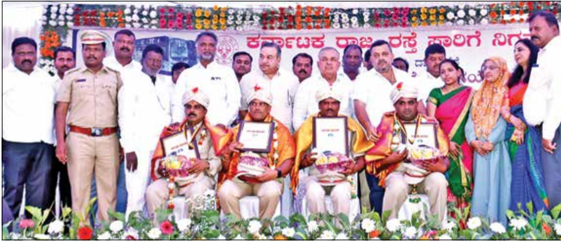
ಶನಿವಾರ ನಡೆದ ಬಸ್ ನಿಲ್ದಾಣ ಉದ್ಘಾಟನಾ ಕಾರ್ಯಕ್ರಮದಲ್ಲಿ ಅಪಘಾತ ರಹಿತವಾಗಿ ಸೇವೆ ಸಲ್ಲಿಸಿದ ಚಾಲಕರಿಗೆ ಬೆಳ್ಳಿ ಪದಕ ವಿತರಿಸಲಾಯಿತು.