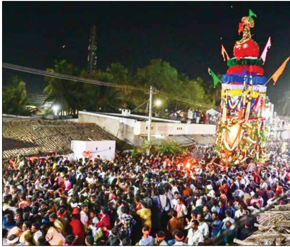
ವೀರೇಶ ದೊರೆಯೇ ನಿನಗಾರು ಸರಿಯೇ?

ದಾವಣಗೆರೆ ಸಮೀಪದ ಆವರಗೋಳ ಗ್ರಾಮದಲ್ಲಿ ಶ್ರೀ ವೀರಭದ್ರೇಶ್ವರ ಮಹಾಸ್ವಾಮಿ ರಥೋತ್ಸವವು ಬುಧವಾರ ಸಂಜೆ ಆಹಾರ ಜನ ಸಾಗರದ ನಡುವೆ ವಿಭೂಷಣೆಯಿಂದ ನೆರವೇರಿತು.