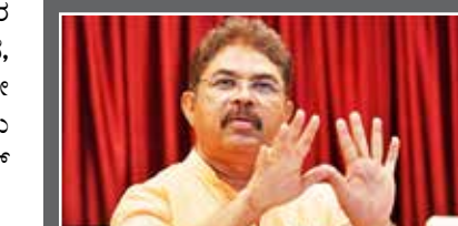
ವಿಪಕ್ಷ ನಾಯಕ ಆರ್. ಅಶೋಕ್ ತರಾಟೆ

ಬೆಂಗಳೂರು, ಫೆ. 12 - ಕಾಂಗ್ರೆಸ್ ಸರ್ಕಾರ ರಾಜ್ಯಪಾಲರ ಬಾಯಲ್ಲಿ ಸುಳ್ಳು ಹೇಳಿಸಿದ್ದಲ್ಲದೆ, ಬಿಜೆಪಿ ಸರ್ಕಾರದ ಯೋಜನೆಗಳನ್ನು ತಮ್ಮದೇ ಯೋಜನೆಯಾಗಿ ಬಿಂಬಿಸಿಕೊಂಡಿದ್ದು ಎಂದು ವಿಧಾನಸಭೆಯ ಪ್ರತಿಪಕ್ಷ ನಾಯಕ ಆರ್.ಅಶೋಕ್ ಇಂದಿಲ್ಲಿ ಆಕ್ರೋಶ ವ್ಯಕ್ತಪಡಿಸಿದ್ದಾರೆ.