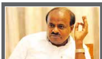
ಜಾಹೀರಾತುಗಳಿಂದ ನಡೆಯುತ್ತಿರುವ ಸರ್ಕಾರ: ಕುಮಾರ ಸ್ವಾಮಿ ಟೀಕೆ

ಬೆಂಗಳೂರು, ಫೆ. 12 - ರಾಜ್ಯಪಾಲರ ಭಾಷಣದಲ್ಲಿ ಉಪ್ಪು, ಹುಳಿ, ಖಾರ ಏನೂ ಇಲ್ಲ. ಇದೊಂದು ಜಾಹೀರಾತುಗಳಿಂದ ನಡೆಯುತ್ತಿರುವ ಸರ್ಕಾರ ಎಂದು ಮಾಜಿ ಸಿಎಂ ಹೆಚ್. ಡಿ.ಕುಮಾರಸ್ವಾಮಿ ಕಿಟಕಿಟಕಿ ಹೇಳಿದರು.