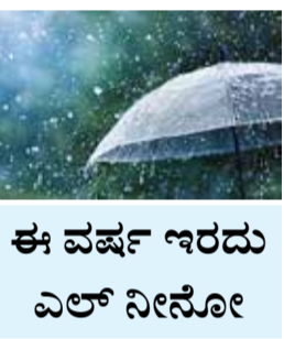
ಈ ವರ್ಷ ಇರದು ಎಲ್ ನೀನೋ

ನವದೆಹಲಿ, ಫೆ. 11 - ಕಳೆದ 2023ರಲ್ಲಿ ಬಿಸಿ ಏರಿಕೆ ಕಾರಣವಾಗಿದ್ದ ಎಲ್ ನೀನೋ, ಈ ವರ್ಷ ಜೂನ್ ತಿಂಗಳಲ್ಲಿ ತಗ್ಗಲಿದೆ. ಇದರಿಂದಾಗಿ ಮುಂಗಾರು ಚೇತರಿಕೆ ಕಾಣಲಿದೆ ಎಂದು ಹವಾಮಾನ ಪರಿಣಿತರು ಅಭಿಪ್ರಾಯ ಪಟ್ಟಿದ್ದಾರೆ. ಪೆಟ್ರೋಲ್ ಸಮುದ್ರದಲ್ಲಿ ತಾಪಮಾನ ಹೆಚ್ಚಳಕ್ಕೆ ಕಾರಣವಾಗಿರುವ ಎಲ್ ನೀನೋ, ವಿಶ್ವದಾದ್ಯಂತ ಹವಾಮಾನದ ಮೇಲೆ ಪರಿಣಾಮ ಬೀರುತ್ತದೆ. ಅದೀಗ ದುರ್ಬಲವಾಗುತ್ತಿದೆ. ಆಗಸ್ಟ್ ವೇಳೆಗೆ ಲಾ ನೀನಾ ಪರಿಸ್ಥಿತಿ ಬರಲಿದೆ ಎಂದು ಎರಡು ಜಾಗತಿಕ ಪರಿಷರ ಸಂಸ್ಥೆಗಳು ಕಳೆದ ವಾರ ಘೋಷಿಸಿವೆ.