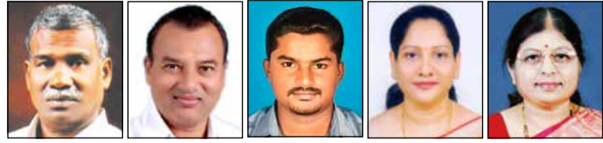
ಒಟ್ಟು 15 ಸ್ಥಾನಗಳಲ್ಲಿ ಐವರು ಪುನರಾಯ್ಕೆ: ಉಳಿದ 10 ಸ್ಥಾನಗಳಿಗೆ ಇಂದು ಚುನಾವಣೆ

ದಾವಣಗೆರೆ, ಫೆ. 10 - ಪ್ರತಿಷ್ಠಿತ ಸಹಕಾರಿ ಬ್ಯಾಂಕ್‌ಗಳಲ್ಲೊಂದಾದ ದಾವಣಗೆರೆ ಅರ್ಬನ್ ಕೋ-ಆಪರೇಟಿವ್ ಬ್ಯಾಂಕ್ ಆಡಳಿತ ಮಂಡಳಿಗೆ ನಾಳೆ ದಿನಾಂಕ 11ರ ಭಾನುವಾರ ಚುನಾವಣೆ ನಡೆಯಲಿದ್ದು, ಒಟ್ಟು 15 ಸ್ಥಾನಗಳ ಪೈಕಿ ಐವರು ಅವಿರೋಧವಾಗಿ ಆಯ್ಕೆಯಾಗಿದ್ದಾರೆ.