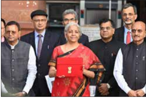
ನಿರ್ಮಲ ಸೀತಾರಾಮನ್ ಬಜೆಟ್‌ನಲ್ಲಿ ಬಡವರು, ಮಹಿಳೆಯರು, ಯುವಕರು ಹಾಗೂ ರೈತರು ಎಂಬ 'ಜಾತಿ'ಗಳಿಗೆ ಆದ್ಯತೆ

'ಸಬ್ಬಾ ಸಾಥ್, ಸಬ್ಬಾ ವಿಕಾಸ್, ಸಬ್ಬಾ ವಿಶ್ವಾಸ್' ಎಂಬುದು ಸರ್ಕಾರದ ಮಂತ್ರವಾಗಿದೆ. 'ಸಬ್ಬಾ ಪ್ರಯಾಸ್' (ಎಲ್ಲರ ಪ್ರಯತ್ನ) ಮೂಲಕ ಕೊರೋನಾದಂತಹ ಸವಾಲುಗಳನ್ನು ಎದುರಿಸಿ ದೇವೆ. ಆತ್ಮನಿರ್ಭರ ಭಾರತದ ಕಡೆ ಹೆಜ್ಜೆ ಹಾಕಿದ್ದೇವೆ.