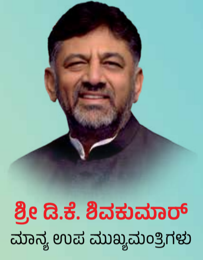
ಶ್ರೀ ಡಿ.ಕೆ. ಶಿವಕುಮಾರ್ ಮಾನ್ಯ ಉಪ ಮುಖ್ಯಮಂತ್ರಿಗಳು

ಸನ್ಮಾನ್ಯ ಮುಖ್ಯಮಂತ್ರಿ ಶ್ರೀ ಸಿದ್ದರಾಮಯ್ಯನವರ ಪ್ರಗತಿಪರ ಮತ್ತು ಸುಸ್ಥಿರ ನಾಯಕತ್ವದಡಿಯಲ್ಲಿ ಜನತೆಗೆ ಸುಭದ್ರ ಬದುಕು ಕಟ್ಟಿಕೊಟ್ಟ 'ಕರ್ನಾಟಕ ಮಾದರಿ ಸರ್ಕಾರ'