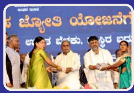
ಸನ್ಮಾನ್ಯ ಮುಖ್ಯಮಂತ್ರಿ ಶ್ರೀ ಸಿದ್ದರಾಮಯ್ಯನವರು ಮತ್ತು ಮಾನ್ಯ ಉಪ ಮುಖ್ಯಮಂತ್ರಿ ಶ್ರೀ ಡಿ.ಕೆ. ಶಿವಕುಮಾರ್ ರವರು ಗೃಹ ಜ್ಯೋತಿ ಗ್ಯಾರಂಟಿ ಯೋಜನೆಗೆ ಬಾಲನೆ ನೀಡುತ್ತಿರುವುದು.