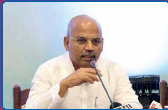
ಯುವನಿಧಿ ಯೋಜನೆ ಬಗ್ಗೆ ಮಾಹಿತಿ ನೀಡುತ್ತಿರುವ ಮಾನ್ಯ ಕೌಶಲ್ಯಾಭಿವೃದ್ಧಿ ಸಚಿವ ಡಾ. ಶರಣ ಪ್ರಕಾಶ್ ಪಾಟೀಲ್

ಪ್ರತಿ ತಿಂಗಳು ಪದವೀಧರರಿಗೆ ರೂ.3000, ಡಿಪ್ಲೋಮಾದಾರರಿಗೆ ರೂ.1500 ನಿರುದ್ಯೋಗ ಭತ್ಯೆ ನೀಡಿಕೆ