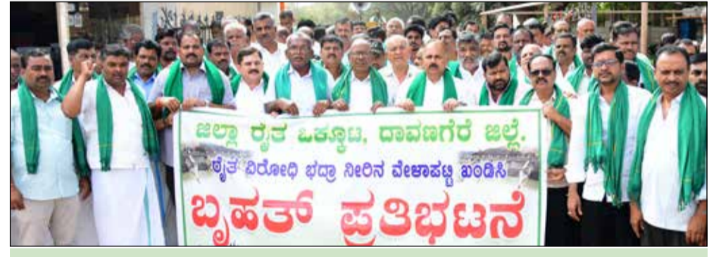
ಜಿಲ್ಲಾ ರೈತ ಒಕ್ಕೂಟದಿಂದ ಪ್ರತಿಭಟನೆ, ರಸ್ತೆ ತಡೆ, ಸರ್ಕಾರಕ್ಕೆ ಮನವಿ