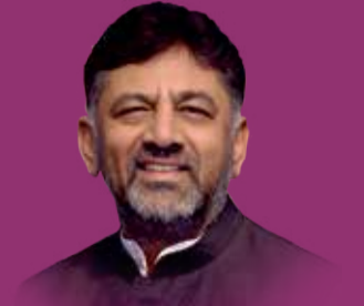
ಶ್ರೀ ಡಿ. ಕೆ. ಶಿವಕುಮಾರ್ ಮಾನ್ಯ ಉಪಮುಖ್ಯಮಂತ್ರಿ

ಕೌಶಲ್ಯಾಭಿವೃದ್ಧಿ, ಉದ್ಯಮಶೀಲತೆ ಹಾಗೂ ಜೀವನೋಪಾಯ ಇಲಾಖೆ