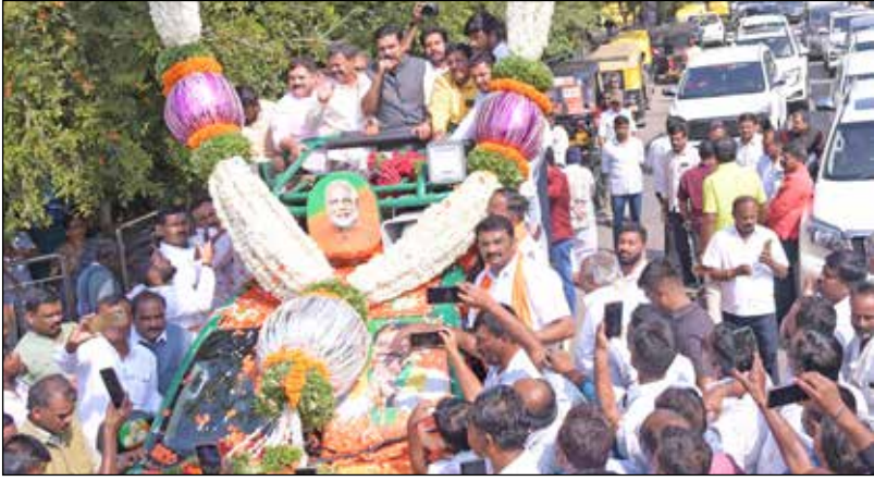
ಬಿಜೆಪಿ ರಾಜ್ಯಾಧ್ಯಕ್ಷ ಬಿ.ವೈ.ವಿಜಯೇಂದ್ರ ಅವರು ಭಾನುವಾರ ನಗರಕ್ಕೆ ಆಗಮಿಸಿದ ಸಂದರ್ಭದಲ್ಲಿ ಅಭಿಮಾನಿ ಬಳಗದಿಂದ ಕಾರ್ ರ್ಯಾಲಿ ಮೂಲಕ ಸ್ವಾಗತಿಸಿ, ಶಾಮನೂರು ರಸ್ತೆಯಲ್ಲಿ ಸನ್ಮಾನಿಸಲಾಯಿತು.