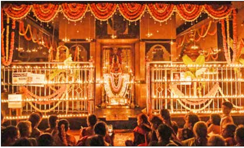
ದಾವಣಗೆರೆ ಕೆ.ಬಿ. ಬಡಾವಣೆ ದೀಕ್ಷಿತ್ ರಸ್ತೆಯಲ್ಲಿರುವ ಶ್ರೀ ರಾಘವೇಂದ್ರ ಸ್ವಾಮಿಗಳ ಮಠದಲ್ಲಿ ಭಾನುವಾರ ಕಡೇ ಕಾರ್ತಿಕೋತ್ಸವ ಸಂಭ್ರಮದಿಂದ ನೆರವೇರಿತು.