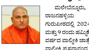
ಮಲೇಬೆನ್ನೂರು, ಡಿ.24- ರಾಜನಹಳ್ಳಿಯ ವಾಲ್ಮೀಕಿ ಗುರುಪೀಠದಲ್ಲಿ 2024ರ ಫೆಬ್ರವರಿ 8 ಮತ್ತು 9 ರಂದು ಹಮ್ಮಿಕೊಂಡಿರುವ 6ನೇ ವರ್ಷದ ವಾಲ್ಮೀಕಿ ಜಾತ್ರೆ ಅಂಗವಾಗಿ ಶ್ರೀ ವಾಲ್ಮೀಕಿ ಪ್ರಸನ್ನಾನಂದ ಸ್ವಾಮೀಜಿ ನಾಳೆ ದಿನಾಂಕ 25 ರಿಂದ ಜನವರಿ 8 ರವರೆಗೆ 2ನೇ ಹಂತದ ರಾಜ್ಯ ಪ್ರವಾಸ ಕೈಗೊಂಡಿದ್ದಾರೆ.

ನಾಳೆ ದಿನಾಂಕ 25ರ ಸೋಮವಾರ ಬೆಳಿಗ್ಗೆ 10ಕ್ಕೆ ಹೊನ್ನೂಳಿ, ಮದ್ಯಾಹ್ನ 1 ಗಂಟೆಗೆ ನ್ಯಾಮತಿ ಮತ್ತು ಸಂಜೆ 4 ಗಂಟೆಗೆ ಶಿಕಾರಿಪುರದಲ್ಲಿ ಹಾಗೂ ದಿನಾಂಕ 26ಕ್ಕೆ ಸೊರಬ, ಸಾಗರ, ಹೊಸನಗರ, ದಿನಾಂಕ 27ಕ್ಕೆ ಶಿವಮೊಗ್ಗ, ಭದ್ರಾವತಿ, ಚನ್ನಗಿರಿ, ದಿನಾಂಕ 28ಕ್ಕೆ ಅಜ್ಜಂಪುರ, ತರೀಕೆರೆ, ಕಡೂರು, ದಿನಾಂಕ 29ಕ್ಕೆ ಚಿಕ್ಕಮಗಳೂರಿನಲ್ಲಿ ಎನ್.ಆರ್.ಪುರ, ಶೃಂಗೇರಿ, ಕೊಪ್ಪ, ದಿನಾಂಕ 30ಕ್ಕೆ ಹಾಸನದಲ್ಲಿ ಜಿಲ್ಲಾ ವ್ಯಾಪ್ತಿಯ ಪೂರ್ವಭಾವಿ ಸಭೆಗಳನ್ನು ಶ್ರೀಗಳು ನಡೆಸಲಿದ್ದಾರೆ.