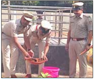
ಹರಪನಹಳ್ಳಿಯಲ್ಲಿ ಕಾರ್ಯಕ್ರಮಕ್ಕೆ ಚಾಲನೆ ನೀಡಿದ ಎಸ್ಸಿ ಶ್ರೀಹರಿಬಾಬು

ಹರಪನಹಳ್ಳಿ, ಡಿ. 2- ವಿಜಯನಗರ ಜಿಲ್ಲೆಯಲ್ಲಿ 356 ಹಳ್ಳಿಗಳಿದ್ದು ಹಂತ ಹಂತವಾಗಿ ಪ್ರತಿ ತಾಲ್ಲೂಕಿನ ಹಳ್ಳಿಗಳಲ್ಲಿ ಗ್ರಾಮ ವಾಸ್ತವ್ಯ ಮಾಡುವ ಮೂಲಕ ಹಳ್ಳಿಗಳಲ್ಲಿರುವ ಸಮಸ್ಯೆಗಳನ್ನು ಬಗೆಹರಿಸುವ ಕಾರ್ಯವನ್ನು ಜನವರಿ 18ರಿಂದ ಹಮ್ಮಿಕೊಳ್ಳಲಾಗುವುದು ಎಂದು ವಿಜಯನಗರ ಎಸ್ಸಿ ಶ್ರೀಹರಿಬಾಬು ಹೇಳಿದರು. ಪಟ್ಟಣದ ನೂತನ ಪೊಲೀಸ್ ಠಾಣೆಯ ಮುಂಬಾಗದಲ್ಲಿ ನೂತನ ಉದ್ಘಾಟನೆಯಲ್ಲಿ ಗಿಡ ನೆಡುವ ಮೂಲಕ ಕಾರ್ಯಕ್ರಮಕ್ಕೆ ಚಾಲನೆ ನೀಡಿ ಮಾತನಾಡಿದರು.