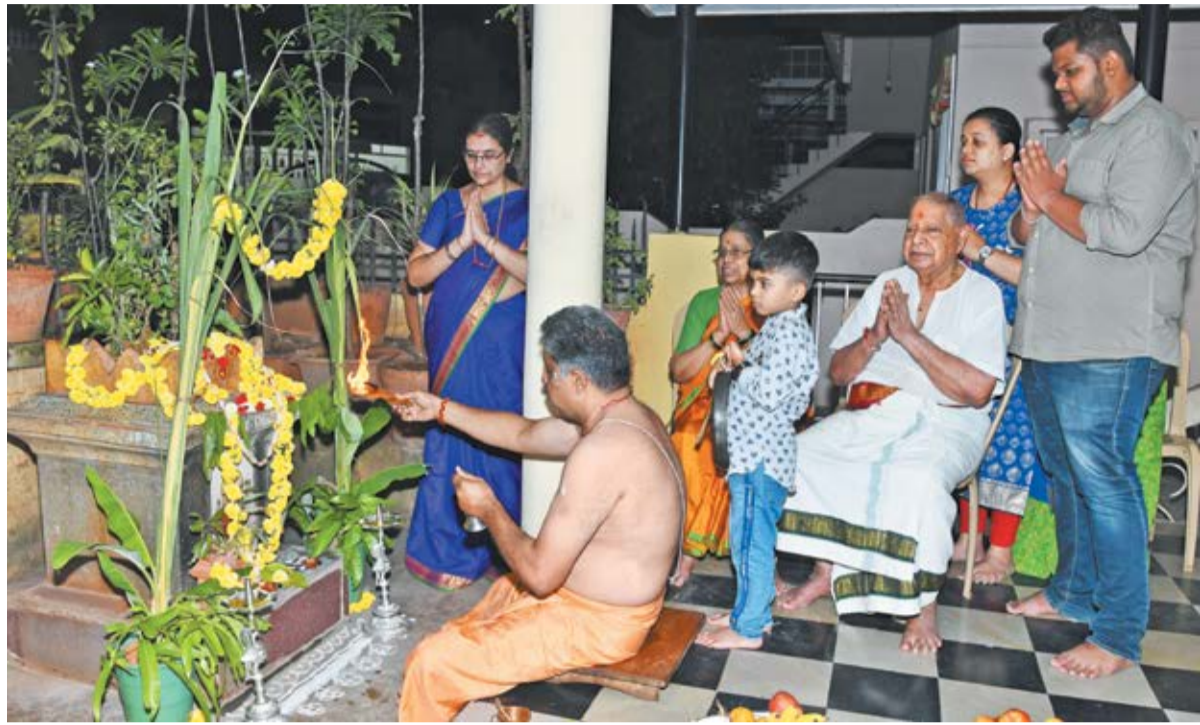
ದಾವಣಗೆರೆ ನಗರದಾದ್ಯಂತ ತುಳಸಿ ವಿವಾಹವನ್ನು ಶುಭವಾರ ಸಂಜೆ ಶ್ರದ್ಧಾ-ಭಕ್ತಿಯಿಂದ ಆಚರಿಸಲಾಯಿತು. ಕಾರ್ತಿಕ ಮಾಸದ ದ್ವಾದಶಿ ತಿಥಿಯಂದು ತುಳಸಿ ವಿವಾಹ ಅಥವಾ ತುಳಸಿ ಪೂಜೆಯನ್ನು ಮಾಡಲಾಗುತ್ತದೆ. ಈ ಹಿನ್ನೆಲೆಯಲ್ಲಿ ಪೂಜಾ ವಸ್ತುಗಳಿಗೆ ಬೆಳ್ಳಿ ಮಾರುಕಟ್ಟೆಯಲ್ಲಿ ಭಾರೀ ಬೇಡಿಕೆ ಉಂಟಾಗಿತ್ತು.