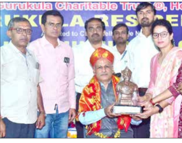
ಬೆಂಗಳೂರಿನಲ್ಲಿ ಸಮರ್ಪಣಾ ಮನೋಭಾವದಿಂದ ಉನ್ನತ ಸಾಧನೆ ಮಾಡಲು ಸಾಧ್ಯವೆಂದು ತಿಳಿಸಿದರು.

ಹೊನ್ನಾಳಿ, ನ. 17 - ವಿದ್ಯಾರ್ಥಿಗಳ ಪ್ರಶ್ನೆ ಮಾಡುವ ಮನೋಭಾವವನ್ನು ರೂಢಿಸಿಕೊಳ್ಳಬೇಕು ಎಂದು ಚಂದ್ರಯಾನ-3 ತಂಡದ ಇಸ್ರೋ ವಿಜ್ಞಾನಿ ದಾರುಕೇಶ್ ಸಲಹೆ ನೀಡಿದರು.