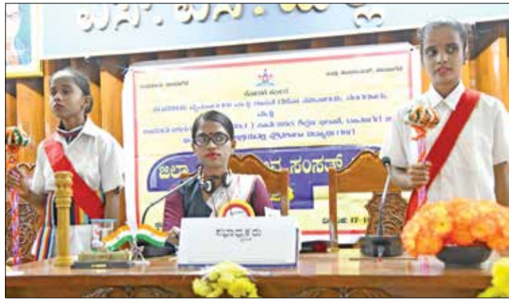
ಜಿಲ್ಲಾ ಪಂಚಾಯತ್ ಸಭಾಂಗಣದಲ್ಲಿ ಶುಕ್ರವಾರ ನಡೆದ ಪ್ರೌಢಶಾಲಾ ವಿಭಾಗದ ಜಿಲ್ಲಾ ಮಟ್ಟದ ಯುವ ಸಂಸತ್ ಸ್ಪರ್ಧೆ ಕಾರ್ಯಕ್ರಮದಲ್ಲಿ ಭಾಗಿಯಾಗಿರುವ ವಿದ್ಯಾರ್ಥಿಗಳು.