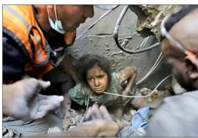
ಉತ್ತರ ಗಾಜು ಪಟ್ಟಿಯ ಜಾಲಿಯಾ ನಿರಾಶ್ರಿತರ ಶಿಬಿರದಲ್ಲಿ ಇಸ್ರೇಲಿ ವಾಯುನಾಳಿಯಿಂದ ನಾಶವಾದ ಕಟ್ಟಡದ ಅವಶೇಷಗಳಿಂದ ಬಾಲಕಿಯನ್ನು ಹೊರತೆಗೆಯಲು ಪ್ರಾಣಿಶಾಸ್ತ್ರೀಯವರ ಪ್ರಯತ್ನಿಸುತ್ತಿರುವುದು.