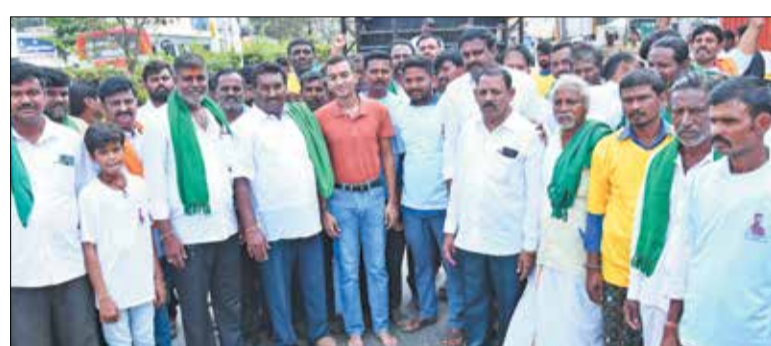
ದಾವಣಗೆರೆ ನಗರದ ಪ್ರಮುಖ ಬೀದಿಗಳಲ್ಲಿ ವಿವಿಧ ಜಾನಪದ ಕಲಾ ತಂಡಗಳೊಂದಿಗೆ ಮಹರ್ಷಿ ವಾಲ್ಮೀಕಿ ಭಾವಚಿತ್ರದ ಬೃಹತ್ ಮೆರವಣಿಗೆ ನಡೆಯಿತು.

ವಾಲ್ಮೀಕಿ ಮತ್ತು ವ್ಯಾಸ ಮುನಿಗಳು ತಮ್ಮ ಮಹಾನ್ ಗ್ರಂಥಗಳ ಮೂಲಕ ಸಮಾಜಕ್ಕೆ