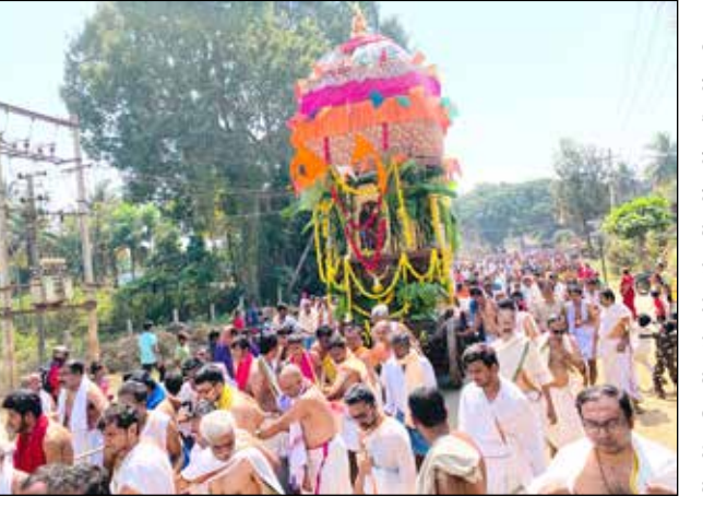
'ಗೋವಿಂದಾ ಗೋವಿಂದಾ' ಎಂಬ ಜಯಘೋಷದೊಂದಿಗೆ ನೂರಾರು ಭಕ್ತರು ರಥ ಎಳೆದು ಸಂಭ್ರಮಿಸಿದರು. ಈ ವೇಳೆ ಭಕ್ತರು ರಥದ ಮೇಲೆ ಬಾಳೆಹಣ್ಣು ಎಸೆದು ಭಕ್ತಿ ಸಮರ್ಪಿಸಿದರು. ವಿವಿಧ ವಾದ್ಯ ಮೇಳಗಳು ರಥೋತ್ಸವಕ್ಕೆ ಮೆರಗು ತಂದವು. ವರ್ಷದಲ್ಲಿ ಎರಡು ಬಾರಿ ರಥೋತ್ಸವ ನಡೆಯುವುದು ಈ ಕೊಮಾರನಹಳ್ಳಿಯ ವಿಶೇಷವಾಗಿದೆ.

ಮಲೇ ಬೆನ್ನೂರು, ಅ.24- ವಿಜಯ ದಶಮಿ ಹಬ್ಬದ ಅಂಗವಾಗಿ ಕೊಮಾರನಹಳ್ಳಿಯಲ್ಲಿ ಮಂಗಳವಾರ ಹಳವನಕಟ್ಟಿ ಶ್ರೀ ಲಕ್ಷ್ಮೀ ರಂಗನಾಥ ಸ್ವಾಮಿಯ ಬ್ರಹ್ಮ ರಥೋತ್ಸವವು ಸಂಭ್ರಮದಿಂದ ಜರುಗಿತು. ರಥದಲ್ಲಿ ಶ್ರೀ ರಂಗನಾಥ ಸ್ವಾಮಿಯ ಉತ್ಸವ ಮೂರ್ತಿಯನ್ನು ಪ್ರತಿಷ್ಠಾಪಿಸಿದ ನಂತರ ರಥಕ್ಕೆ ಪೂಜೆ ಸಲ್ಲಿಸಿ,