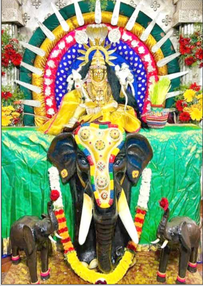
ನಗರದೇವತೆ ಶ್ರೀ ದುರ್ಗಾಂಬಿಕಾ ದೇವಿ ದೇವಸ್ಥಾನದಲ್ಲಿ ಶ್ರೀ ದುರ್ಗಾಂಬಿಕಾ ದೇವಿಗೆ ಗಜಲಕ್ಷ್ಮಿ ಅಲಂಕಾರ