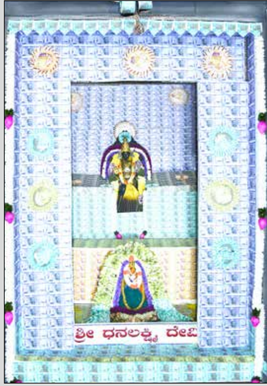
ಎಸ್.ಕೆ.ಎಸ್ ರಸ್ತೆ ಕನ್ನಿಕಾ ಪರಮೇಶ್ವರಿ ದೇವಿಗೆ ಶ್ರೀ ಧನಲಕ್ಷ್ಮಿ ದೇವಿ ಅಲಂಕಾರ