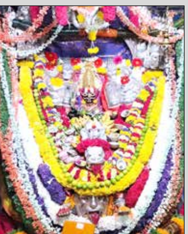
ಉಚ್ಚಂದಿಗುಡದ ಶ್ರೀ ಉತ್ಸವಾಂಬದೇವಿಗೆ ವಿಶೇಷ ಅಲಂಕಾರ