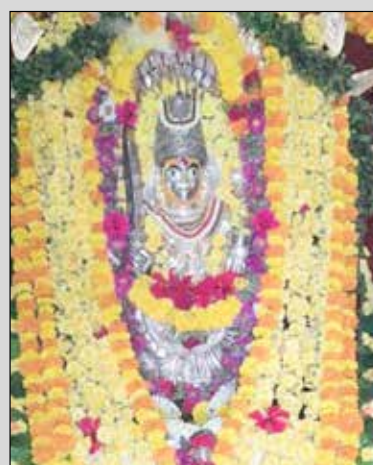
ಮಲೇಬೆನ್ನೂರು ಗ್ರಾಮದೇವತೆ ವಿಶ್ವನಾಥೇಶ್ವರಿ ಅಮ್ಮನವರಿಗೆ ವಿಶೇಷ ಅಲಂಕಾರ