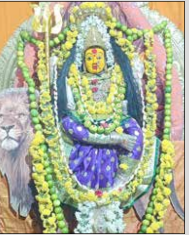
ಹಳೇಬೇತೂರು ರಸ್ತೆಯ ಶ್ರೀ ಬನಶಂಕರಿ ದೇವಿಗೆ ಶ್ರೀ ಚೌಡೇಶ್ವರಿ ದೇವಿ ಅಲಂಕಾರ