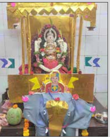
ಕುಂಬಾರ ಹೇಟಿಯ ಶ್ರೀ ಬನ್ನಿಕಾಳಿಕಾಂಬ ದೇವಿಗೆ ಅಂಬಾರಿ ಅಲಂಕಾರ