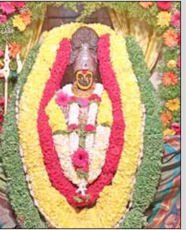
ವಿನೋಬನಗರದ ಶ್ರೀ ಚೌಡೇಶ್ವರಿ ದೇವಿಗೆ ವಿಶೇಷ ಅಲಂಕಾರ