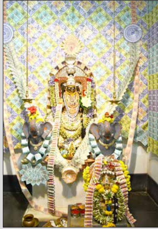
ತೊಗಟವೀರ ಸಮಾಜದ ದಾವಲ್‌ಪೇಟೆಯ ಶ್ರೀ ಚೌಡೇಶ್ವರಿ ದೇವಿಗೆ ಲಕ್ಷ್ಮೀ ನೋಟಿನ ಅಲಂಕಾರ