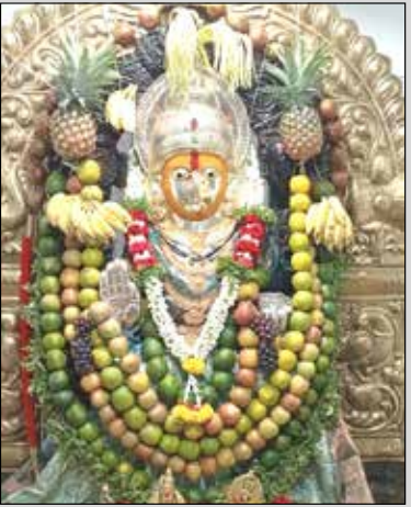
ಕೆಟಜೆ ನಗರ ಶ್ರೀ ತುಳುಜಾ ಭವಾನಿ ದೇವಸ್ಥಾನದಲ್ಲಿ ವಿಶೇಷ ಅಲಂಕಾರ