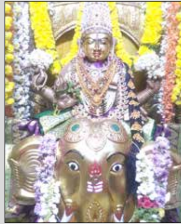
ರಿಂಗ್ ರಸ್ತೆ ಶಾರದಾಂಬ ದೇವಸ್ಥಾನದಲ್ಲಿ ಶ್ರೀ ಗಜಲಕ್ಷ್ಮಿ ಅಲಂಕಾರ