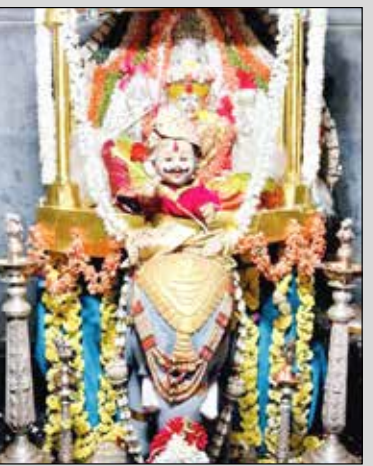
ನಿಟ್ಟುವಳ್ಳಿಯ ಶ್ರೀ ದುರ್ಗಾಂಬಿಕಾ ದೇವಿಗೆ ಜಂಬೂಸವಾರಿ ಅಲಂಕಾರ