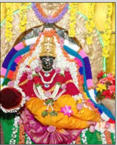
ಡಿಸಿಎಂ ಹೆನ್ರಿಕೆ ವಾಸವಿ ಅಮ್ಮನವರ ದೇವಸ್ಥಾನದಲ್ಲಿ ಪುಷ್ಪಶಯನ ಅಲಂಕಾರ