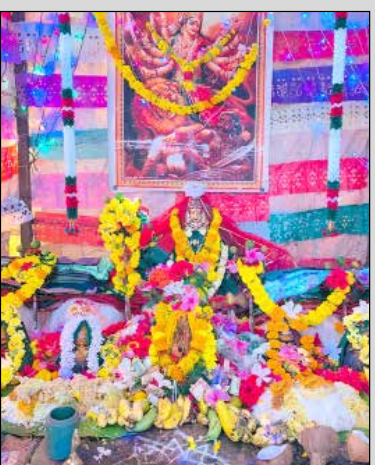
ಜಿಗಲಿ ಕ್ಯಾಂಪ್‌ನ ಶ್ರೀ ಚೌಡೇಶ್ವರಿ ದೇವಸ್ಥಾನದಲ್ಲಿ ವಿಶೇಷ ಅಲಂಕಾರ