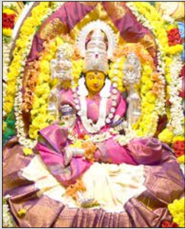
ಕಾಳಿಕಾದೇವಿ ರಸ್ತೆಯ ಶ್ರೀ ಕಾಳಿಕಾದೇವಿ ವಿಶ್ವಕರ್ಮ ದೇವಸ್ಥಾನದಲ್ಲಿ ಸರ್ವ ಅಲಂಕಾರ