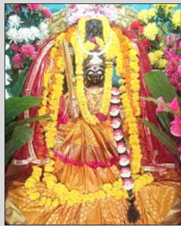
ಪಿ.ಬಿ ರಸ್ತೆಯ ಪಂಚದೇವಸ್ಥಾನ ಮಹಾ ಕ್ಷೇತ್ರದಲ್ಲಿ ಕೊಪ್ಪದಾಂಬ ದೇವಿಗೆ ವಿಶೇಷ ಅಲಂಕಾರ