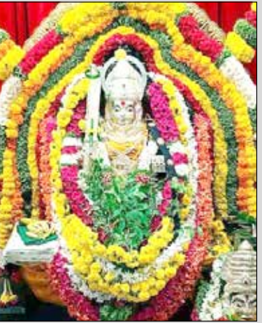
ಬೇತೂರು ರಸ್ತೆಯ ಶಾಸ್ತ್ರಿ ಕಣದ ಶ್ರೀ ಬನ್ನಿಕಾಳಿ ದೇವಿಗೆ ಸರ್ವ ಭೂಷಿತ ಅಲಂಕಾರ