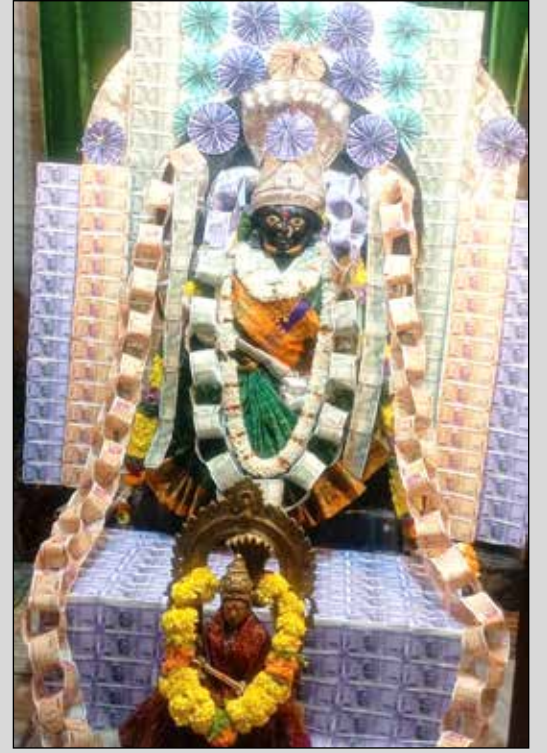
ದೇವರಾಜ ಅರಸು ಬಡಾವಣೆ ಶ್ರೀ ಮಾತಾ ಅನ್ನಪೂರ್ಣೇಶ್ವರಿ ದೇವಿಗೆ ಧನಲಕ್ಷ್ಮಿ ಅಲಂಕಾರ