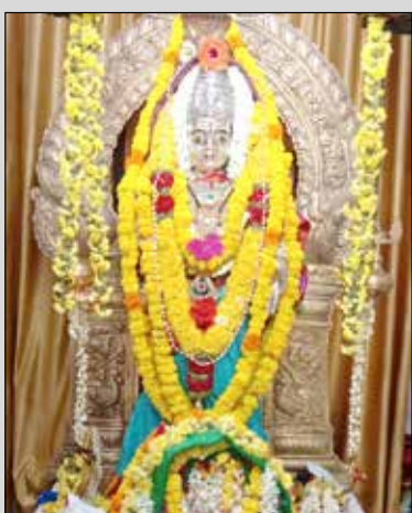
ವಿದ್ಯಾನಗರ ಶಿವ ಪಾರ್ವತಿ ದೇವಸ್ಥಾನದಲ್ಲಿ ಶ್ರೀ ಅಮ್ಮನವರಿಗೆ ವಿಶೇಷ ಅಲಂಕಾರ