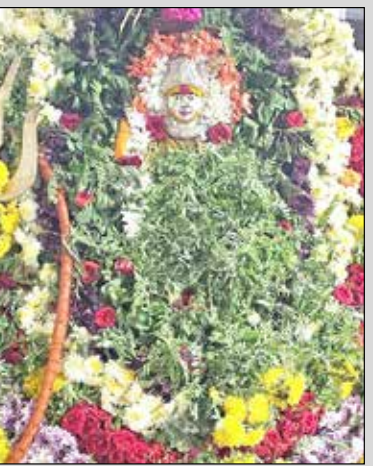
ನಿಟ್ಟುವಳ್ಳಿ ಬನಶಂಕರಿ ದೇವಿಗೆ ವಿಶೇಷ ಅಲಂಕಾರ