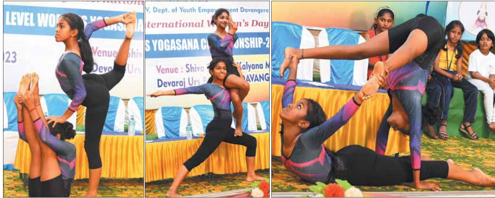
ದಾವಣಗೆರೆ ನಗರದ ಶಿವ ಪಾರ್ವತಿ ಕಲ್ಯಾಣ ಮಂಟಪದಲ್ಲಿ ಭಾನುವಾರ ಸಪ್ತರ್ಷಿ ಯೋಗಧಾರ ಸ್ಪೋರ್ಟ್ಸ್ ಅಕಾಡೆಮಿ ಆಯೋಜಿಸಿದ್ದ ರಾಷ್ಟ್ರಮಟ್ಟದ ಯೋಗಾಸನ ಸ್ಪರ್ಧಾ ಕಾರ್ಯಕ್ರಮದಲ್ಲಿ ಯೋಗ ಸ್ವರೂಪಿಣಿಗಳಿಗೆ ಸನ್ಮಾನ.