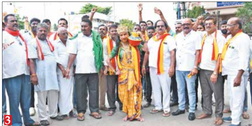
1. ಕನ್ನಡ ಪರ ಸಂಘಟನೆಗಳು ಕರೆ ನೀಡಲಾಗಿದ್ದ ಕರ್ನಾಟಕ ಬಂದ್ ಅಂಗವಾಗಿ ದಾವಣಗೆರೆ ಅಶೋಕ ರಸ್ತೆಯಲ್ಲಿ ಅಂಗಡಿ ಮುಂಗಟ್ಟುಗಳು ಮುಚ್ಚಲ್ಪಟ್ಟಿದ್ದವು. 2. ಕರವೇಯಿಂದ ಗುರುಭವನದ ಮುಂದೆ ಪ್ರತಿಭಟನೆ. 3. ಕಾವೇರಿ ವೇಷಧಾರಿಯೊಂದಿಗೆ ಜಯದೇವ ವೃತ್ತದಲ್ಲಿ ವಿವಿಧ ಸಂಘಟನೆಗಳ ಮುಖಂಡರು ಪ್ರತಿಭಟಿಸಿದರು.