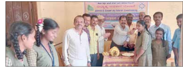
ಮುಂದಾಗಿದ್ದು, ತಾಲ್ಲೂಕಿನ 153 ಸರ್ಕಾರಿ ಪ್ರೌಢಶಾಲೆ ಮತ್ತು 89 ಅನುದಾನಿತ ಶಾಲೆಗಳ 1 ರಿಂದ 8 ತರಗತಿಯ 21760 ವಿದ್ಯಾರ್ಥಿಗಳು ಸೇರಿದಂತೆ, ಒಟ್ಟು 27800 ವಿದ್ಯಾರ್ಥಿಗಳು ಈ ಸೌಲಭ್ಯಗಳನ್ನು ಪಡೆಯಲಿದ್ದಾರೆ ಎಂದರು.

ಹರಿಹರ, ಆ.18- ವಿದ್ಯಾರ್ಥಿಗಳ ಪೌಷ್ಟಿಕ ಆಹಾರ ಸೇವನೆ ಮಾಡುವುದರಿಂದ ದೇಹದಲ್ಲಿ ಬೌದ್ಧಿಕ ಹಾಗೂ ಮಾನಸಿಕ ಬೆಳವಣಿಗೆಯಾಗಿ ಜ್ಞಾನ ಇಮ್ಮಡಿಯಾಗುತ್ತದೆ ಎಂದು ಕ್ಷೇತ್ರ ಶಿಕ್ಷಣಾಧಿಕಾರಿ ಎಂ. ಹನುಮಂತಪ್ಪ ಹೇಳಿದರು. ನಗರದ ಹೊರವಲಯದ ಗುತ್ತೂರು ಸರ್ಕಾರಿ ಪ್ರೌಢಶಾಲಾ ಆವರಣದಲ್ಲಿ ವಿದ್ಯಾರ್ಥಿಗಳಿಗೆ ರಾಜ್ಯ ಸರ್ಕಾರವು ಘೋಷಣೆ ಮಾಡಿರುವ ಬಾಳೆಹಣ್ಣು ಮೊಟ್ಟೆ, ಶೇಂಗಾ ಚಿಕ್ಕಿ ವಿತರಣೆ ಸಮಾರಂಭವನ್ನು ಉದ್ಘಾಟಿಸಿ ಅವರು ಮಾತನಾಡಿದರು. ಹಿಂದಿನ ದಿನಗಳಲ್ಲಿ ಕೇಂದ್ರ ಸರ್ಕಾರದ ವತಿಯಿಂದ ಪ್ರಾಥಮಿಕ ಶಾಲೆಯ ಮಕ್ಕಳು ಅಪೌಷ್ಟಿಕ ಆಹಾರದಿಂದ ನರಳಬಾರದು ಎಂಬ ದೃಷ್ಟಿಯಿಂದ ಬಿಸಿ ಉಟದ ಜೊತೆಗೆ ಬಾಳೆ ಹಣ್ಣು, ಮೊಟ್ಟೆ, ಶೇಂಗಾ ಚಿಕ್ಕಿ ವಿತರಣೆ ಮಾಡಲಾಗುತ್ತಿತ್ತು. ಆದರೆ ಈಗ ರಾಜ್ಯ ಸರ್ಕಾರವು ಅದನ್ನು ಪ್ರೌಢಶಾಲಾ ವಿದ್ಯಾರ್ಥಿಗಳಿಗೂ ವಿಸ್ತರಿಸಿ, ಪ್ರೌಢಶಾಲಾ ವಿದ್ಯಾರ್ಥಿಗಳಿಗೆ ವಿತರಣೆ ಮಾಡಲು