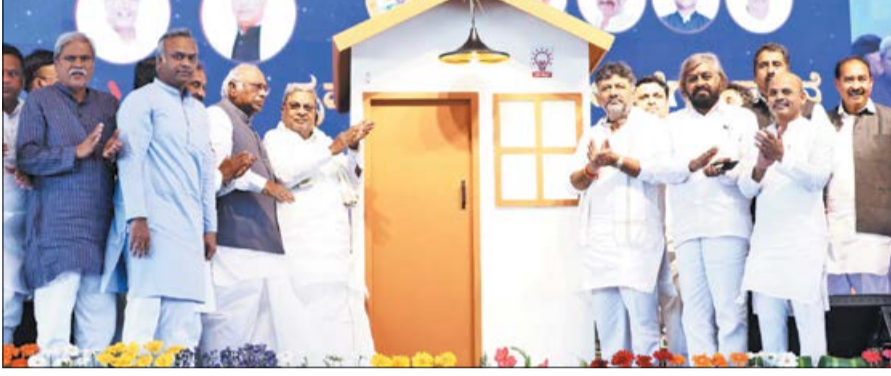
ಬೆಂಗಳೂರು, ಆ.5 - ಗ್ಯಾರಂಟಿ ಯೋಜನೆ ಗಳಿಂದ ರಾಜ್ಯದ ಅಭಿವೃದ್ಧಿಗೆ ಹಿನ್ನಡೆಯಾಗುವುದಿಲ್ಲ ಎಂದು ಮುಖ್ಯಮಂತ್ರಿ ಸಿದ್ದರಾಮಯ್ಯ ಭರವಸೆ ನೀಡಿದ್ದಾರೆ.

'ಗೃಹಜ್ಯೋತಿ' ಉದ್ಘಾಟನಾ ಸಮಾವೇಶದಲ್ಲಿ ಮುಖ್ಯಮಂತ್ರಿ ಸಿದ್ದರಾಮಯ್ಯ ಸ್ಪಷ್ಟನೆ