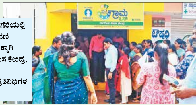
ದಾವಣಗೆರೆಯಲ್ಲಿ ನೋಂದಣಿ ಸುಗಮಕ್ಕಾಗಿ 27 ಹೊಸ ಕೇಂದ್ರ, 143 ಪ್ರಜಾಪ್ರತಿನಿಧಿಗಳ ನೇಮಕ

ದಾವಣಗೆರೆ, ಜು. 28 - ಜಿಲ್ಲೆಯಲ್ಲಿ ಗೃಹ ಲಕ್ಷ್ಮಿ ಯೋಜನೆಗೆ 4.24 ಲಕ್ಷ ಅರ್ಜಿ ದಾಖಲಿಸುವ ಗುರಿ ಇದ್ದು, ಇದುವರೆಗೂ 2.20 ಲಕ್ಷದಷ್ಟು ಅರ್ಜಿಗಳು ದಾಖಲಾಗಿವೆ. ಇದ ರೊಂದಿಗೆ ಯೋಜನೆಗೆ ಅರ್ಜಿ ದಾಖಲಿಸುವಲ್ಲಿ ಅರ್ಧದಷ್ಟು ದಾಖಲಿಸಿದಂತಾಗಿದೆ. ಈ ಯೋಜನೆಯ ಫಲಾನುಭವಿಗಳ ಖಾತೆಗೆ ತಿಂಗಳಿಗೆ 2 ಸಾವಿರ ರೂ. ಜಮಾ ಮಾಡಲಾಗುವುದು.