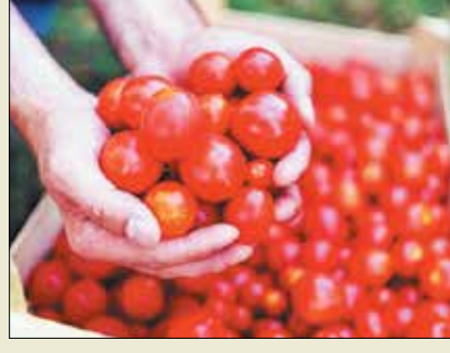
ಈ ಹಿನ್ನೆಲೆಯಲ್ಲಿ ರಾಷ್ಟ್ರೀಯ ಕೃಷಿ ಸಹಕಾರಿ ಮಾರುಕಟ್ಟೆ ಒಕ್ಕೂಟ (ಸೆಫ್‌ಡ್) ಹಾಗೂ ರಾಷ್ಟ್ರೀಯ ಸಹಕಾರಿ ಗ್ರಾಹಕರ ಒಕ್ಕೂಟ (ಎನ್.ಸಿ.ಎಸ್.ಎಫ್.)ಗಳು ಟೊಮ್ಯಾಟೋ ಖರೀದಿಗೆ ಮುಂದಾಗಿವೆ.

ನವದೆಹಲಿ, ಜು. 12 - ಟೊಮ್ಯಾಟೋ ಚಲ್ಲರ ಮಾರಾಟ ಬೆಲೆ ದಾಖಲೆ ಮಟ್ಟಕ್ಕೆ ಹೆಚ್ಚಾಗಿರುವ ಹಿನ್ನೆಲೆಯಲ್ಲಿ ಕ್ರಮಕ್ಕೆ ಮುಂದಾಗಿರುವ ಕೇಂದ್ರ ಸರ್ಕಾರ, ಸಹಕಾರಿಗಳಾದ ಸೆಫ್‌ಡ್ ಹಾಗೂ ಎನ್.ಸಿ.ಎಸ್.ಎಫ್.ಗಳು ಟೊಮ್ಯಾಟೋ ವಿತರಿಸುವಂತೆ ತಿಳಿಸಿದೆ. ಆಂಧ್ರ ಪ್ರದೇಶ, ಕರ್ನಾಟಕ ಹಾಗೂ ಮಹಾರಾಷ್ಟ್ರಗಳಿಂದ ಟೊಮ್ಯಾಟೋ ಖರೀದಿಸಲಾಗುವುದು. ಬೆಲೆ ಹೆಚ್ಚಾಗಿರುವ ರಾಜ್ಯಗಳ ಗ್ರಾಹಕರಿಗೆ ಜುಲೈ 14ರಿಂದ ರಿಯಾಯಿತಿ ದರದಲ್ಲಿ ಮಾರಾಟ ಮಾಡಲಾಗುವುದು ಎಂದು ಕೇಂದ್ರ ಗ್ರಾಹಕರ ವ್ಯವಹಾರಗಳ ಸಚಿವಾಲಯದ ಹೇಳಿಕೆಯಲ್ಲಿ ತಿಳಿಸಲಾಗಿದೆ. ದೇಶದ ಹಲವೆಡೆ ಭಾರೀ ಮಳೆ ಸುರಿಯುತ್ತಿರುವ ಕಾರಣ ಕೆಲ ಭಾಗಗಳಲ್ಲಿ ಟೊಮ್ಯಾಟೋ ಬೆಲೆ ಕೆ.ಜಿ.ಗೆ 200 ರೂ.ಗಳವರೆಗೆ ತಲುಪಿದೆ.