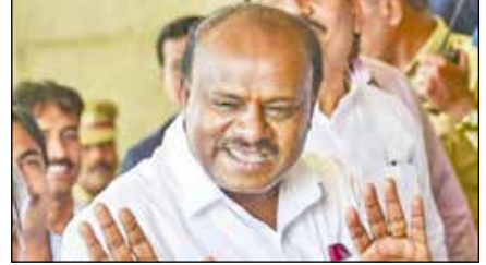
ಮಾಡುತ್ತಿದ್ದೀರಿ. ಆದರೆ, ಈ ಗ್ಯಾರಂಟಿಗಳ ಸೈಡ್ ಎಫೆಕ್ಟ್ ಗಳ ಬಗ್ಗೆ ಏನು ಮಾಡಿದ್ದೀರಿ? ಗ್ಯಾರಂಟಿಗಳ ಬಾಧೆಗೆ ತುತ್ತಾದವರಿಗೆ ನೀವು ಏನಾದರೂ ಒಳ್ಳೆಯದು ಮಾಡಬೇಕಲ್ಲವೇ? ಎಂದು ಅವರು ಒತ್ತಾಯ ಮಾಡಿದರು.

ಬೆಂಗಳೂರು, ಜು. 12 - ರಾಜ್ಯದ ಜನತೆಗೆ ಐದು ಅಂಶಗಳ ಗ್ಯಾರಂಟಿ ನೀಡಿದ್ದ ಕಾಂಗ್ರೆಸ್ ಪಕ್ಷವು, ಅಧಿಕಾರಕ್ಕೆ ಬಂದ ಮೇಲೆ ಕಾಸಿಗಾಗಿ ಪೋಸ್ಟಿಂಗ್ ಗ್ಯಾರಂಟಿ ನೀಡಲು ಹೊರಟಿದೆ ಎಂದು ಬಿಜೆಪಿ ಶಾಸಕರಾದ ಪಕ್ಕದ ನಾಯಕ ಹೆಚ್.ಡಿ. ಕುಮಾರಸ್ವಾಮಿ ಅವರು ಗಂಭೀರ ಆರೋಪ ಮಾಡಿದ್ದಾರೆ.