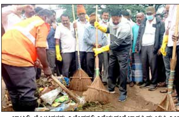
ಬಾಟಲೆ, ಲೋಟಗಳನ್ನು ಎಲ್ಲೆಡೆರಲ್ಲಿ ಎಸೆಯದಂತೆ ಜಾಗೃತಿ ಮೂಡಿಸಿ ಎಂದು ಬಾರ್ ಮಾಲೀಕರಿಗೆ ತಿಳಿಸಿದರು.