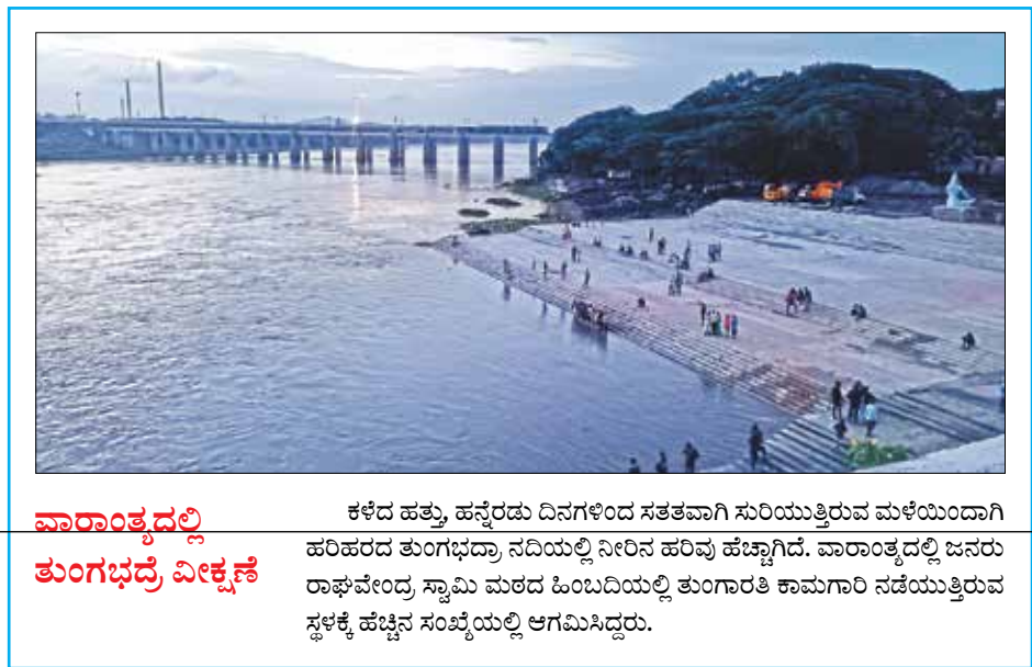
ವಾರಾಂತ್ಯದಲ್ಲಿ ತುಂಗಭದ್ರೆ ನೀಕ್ಷಣ ಕಳೆದ ಹತ್ತು ಹನ್ನೆರಡು ದಿನಗಳಿಂದ ಸತತವಾಗಿ ಸುರಿಯುತ್ತಿರುವ ಮಳೆಯಿಂದಾಗಿ ಹರಿಹರದ ತುಂಗಭದ್ರಾ ನದಿಯಲ್ಲಿ ನೀರಿನ ಹರಿವು ಹೆಚ್ಚಾಗಿದೆ. ವಾರಾಂತ್ಯದಲ್ಲಿ ಜನರು ರಾಘವೇಂದ್ರ ಸ್ವಾಮಿ ಮಠದ ಹಿಂಬದಿಯಲ್ಲಿ ತುಂಗಾಂತಿ ಕಾಮಗಾರಿ ನಡೆಯುತ್ತಿರುವ ಸ್ಥಳಕ್ಕೆ ಹೆಚ್ಚಿನ ಸಂಖ್ಯೆಯಲ್ಲಿ ಆಗಮಿಸಿದ್ದರು.