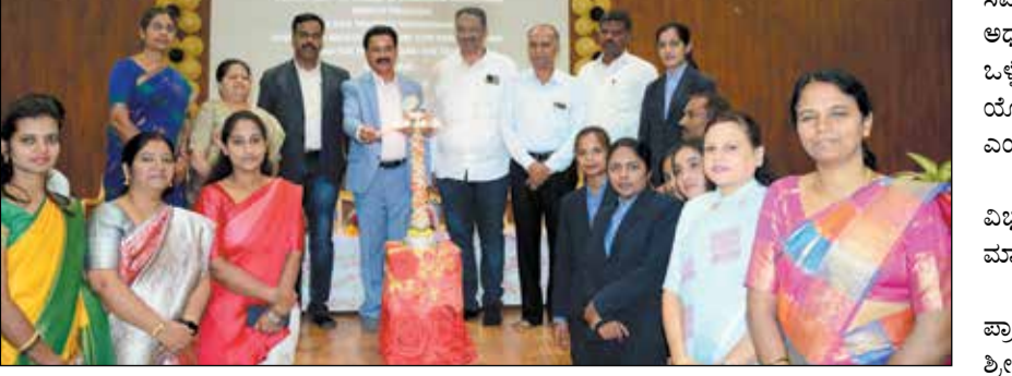
ವಿದ್ಯಾರ್ಥಿಗಳಿಗಲ್ಲದೇ ಅಧ್ಯಾಪಕರಿಗೆ ತರಬೇತಿ ಆಯೋಜಿಸಬೇಕು. ಇದರಿಂದ ಸಂಶೋಧನಾ ಕೌಶಲ್ಯ ಬೆಳೆಯಲು ಸಾಧ್ಯವಾಗುತ್ತದೆ ಎಂದರು. ವಿದ್ಯಾರ್ಥಿಗಳು ಸಮಾಜಮುಖಿ ಯೋಜನಾ ಕಾರ್ಯಗಳ ಬಗ್ಗೆ ನಿಗಮವಿಸಬೇಕು. ಅತ್ಯುತ್ತಮ ಯೋಜನೆಯನ್ನು ಸಿದ್ಧಗೊಳಿಸಿದರೆ ಅದು ಜ್ಞಾನಾಭಿವೃದ್ಧಿಗೆ ದಾರಿಯಾಗುತ್ತದೆ ಎಂದು ಹೇಳಿದರು. ಸಾಮಾಜಿಕ, ಆರ್ಥಿಕ ಸಮಸ್ಯೆಗಳು, ರಾಜಕೀಯ

ಸಂಶೋಧನಾ ವಿಷಯದ ಆಯ್ಕೆ ಬಹಳ ಮುಖ್ಯವಾಗಿದ್ದು, ಯುಜಿಸಿ ಇದನ್ನು ಕಡ್ಡಾಯಗೊಳಿಸಿದೆ.