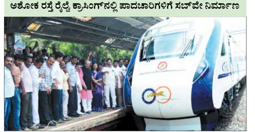
ಅಶೋಕ ರಸ್ತೆ ರೈಲ್ವೆ ಕ್ರಾಸಿಂಗ್‌ನಲ್ಲಿ ಪಾದಚಾರಿಗಳಿಗೆ ಸಬ್‌ವೇ ನಿರ್ಮಾಣ