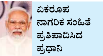
ಏಕರೂಪ ನಾಗರಿಕ ಸಂಹಿತೆ ಪ್ರತಿಪಾದಿಸಿದ ಪ್ರಧಾನಿ

ಪ್ರತಿಪಕ್ಷಗಳು ನಮ್ಮ ವಿರುದ್ಧ ಆರೋಪ ಮಾಡುತ್ತಿವೆ. ಆದರೆ, ವ್ಯಾಪಕವಾಗಿ ಅವರು ಮುಸ್ಲಿಂ - ಮುಸ್ಲಿಂ ಎಂಬ ಮತದ ಹೇಳುತ್ತಿವೆ. ಅವರು ನಿಜವಾಗಿಯೂ ಮುಸ್ಲಿಮರ ಪರ ಕಾಳಜಿ ಹೊಂದಿದ್ದರೆ, ಮುಸ್ಲಿಂ ಕುಟುಂಬಗಳು ಶಿಕ್ಷಣ ಹಾಗೂ ಉದ್ಯೋಗದಲ್ಲಿ ಹಿಂದೆ ಬೀಳುತ್ತಿರಲಿಲ್ಲ