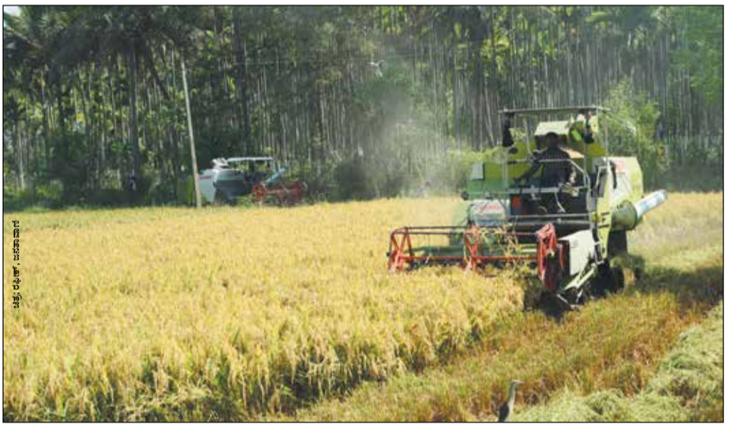
ಭತ್ತದ ಕಟಾವು.. ದಾವಣಗೆರೆ ಜಿಲ್ಲೆಯ ವಿವಿಧೆಡೆ ಬೇಸಿಗೆ ಹಂಗಾಮಿನ ಭತ್ತದ ಕಟಾವು ಭರದಿಂದ ನಡೆಯುತ್ತಿದೆ. ವಿಧಾನಸಭಾ ಚುನಾವಣೆ ಹಿನ್ನೆಲೆಯಲ್ಲಿ ಕುಂತಿಗೊಂದಿದ್ದ ಕೃಷಿ ಚಟುವಟಿಕೆ ಮತ್ತೆ ಆರಂಭವಾಗಿದೆ.