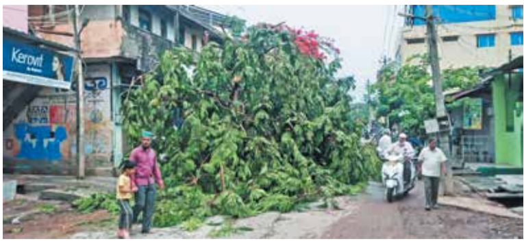
ಹರಿಹರ, ಮೇ 10- ನಗರದಲ್ಲಿ ಸಂಜೆ ಬಡಾವಣೆಯಲ್ಲಿ ಮರಗಳು ಮತ್ತು ವಿದ್ಯುತ್ ಧಾರಾಕಾರವಾಗಿ ಸುರಿದ ಮಳೆ ಗಾಳಿಗೆ ಹಲವಾರು ಕಂಬಗಳು ನೆಲಕ್ಕೆ ಬಿದ್ದು ಸಾಕಷ್ಟು ಪ್ರಮಾಣದಲ್ಲಿ ಸ್ಥಿತಿಗೊಂಡಿದ್ದವು.

ಹಾನಿ ಸಂಭವಿಸಿದೆ. ವಿವಿಧ ಬಡಾವಣೆಗಳಲ್ಲಿ ಮನೆಗಳಿಗೆ ನೀರು ನುಗ್ಗಿದೆ. ಮರಗಳು ಬಿದ್ದು ಹಲವಾರು ಕಾರು ಹಾಗೂ ಬೈಕ್‌ಗಳಿಗೆ ಹಾನಿಯಾಗಿದೆ. ಶೋಭಾ ಟಾಕೀಸ್ ರಸ್ತೆ, ಹಳೆ ಪಿ.ಬಿ.ರಸ್ತೆ, ಗಿರಿಯಮ್ಮ ಕಾಲೇಜು ಮುಂಭಾಗ, ಬಸ್ ನಿಲ್ದಾಣ ಹತ್ತಿರ, ಶಿವಮೊಗ್ಗ ರಸ್ತೆ ಮತ್ತು ವಿವಿಧ ಪ್ರಮುಖ ರಸ್ತೆಗಳ ಮಧ್ಯದಲ್ಲಿ ಬೃಹತ್ ಪ್ರಮಾಣದ ಮರಗಳು ಬಿದ್ದಿದ್ದರಿಂದ ವಾಹನಗಳ ಸಂಚಾರಕ್ಕೆ ಅಡಚಣೆ ಆಗಿತ್ತು. ತಡರಾತ್ರಿಯವರೆಗೆ ವಿದ್ಯುತ್ ಸಂಪರ್ಕವನ್ನು ಕಡಿತ ಗೊಳಿಸಲಾಗಿತ್ತು. ನಗರದಲ್ಲಿ ವ್ಯಾಪಾರ ವಹಿವಾಟು ಸ್ಥಗಿತಗೊಂಡಿದ್ದವು.