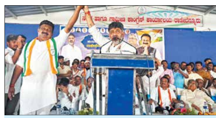
ರಾಣೇಬೆನ್ನೂರಿನಲ್ಲಿ ಕಾಂಗ್ರೆಸ್ ಬಹಿರಂಗ ಸಭೆ