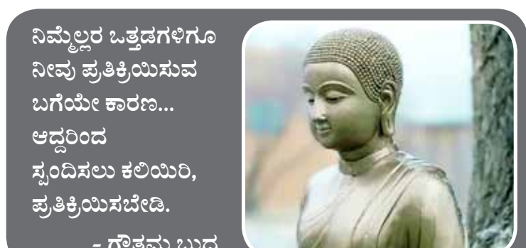
ನಿಮ್ಮಲ್ಲಿ ಒತ್ತಡಗಳಿಗೂ ನೀವು ಪ್ರತಿಕ್ರಿಯಿಸುವ ಬಗೆಯೇ ಕಾರಣ... ಆದ್ದರಿಂದ ಸ್ಪಂದಿಸಲು ಕಲಿಯಿರಿ, ಪ್ರತಿಕ್ರಿಯಿಸಬೇಡಿ.

ಅಜ್ಞಾನದಿಂದ ಜ್ಞಾನದಡೆಗೆ ಸಾಗುವುದೇ ಮುಕ್ತಿಯ ಮೊದಲ ಹೆಜ್ಜೆ. ಬುದ್ಧ ಕ್ರಿ.ಪೂ. 566 ರಲ್ಲಿ ಹುಣ್ಣಿಮೆಯಂದು ಜನಿಸಿದರು. ಹುಣ್ಣಿಮೆಯಂದೇ ಜ್ಞಾನೋದಯವನ್ನು ಪಡೆದರು, ಇವರ ಪರಿನಿರ್ವಾಣದ ಕಾಲ ಕ್ರಿ.ಪೂ. 486 ಹುಣ್ಣಿಮೆಯಂದೇ ಆಗಿರುತ್ತದೆ. ಇದು ಕಾಕತಾಳಿಯಪೂಜೆ, ಪವಾಡಪೂಜೆ ತಿಳಿಯದು. ಬುದ್ಧನ 10 ಸಂಪೂರ್ಣ ಮಾರ್ಗಗಳು: ದಾನ, ಧ್ಯಾನ, ಶೀಲ, ತ್ಯಾಗ, ಪ್ರಜ್ಞೆ, ಪ್ರಯತ್ನಶೀಲತೆ, ತಾಳ್ಮೆ ಸತ್ಯ, ದೃಢಸಂಕಲ್ಪ, ಮೈತ್ರಿ ಮತ್ತು ಉಪೇಕ್ಷೆ.