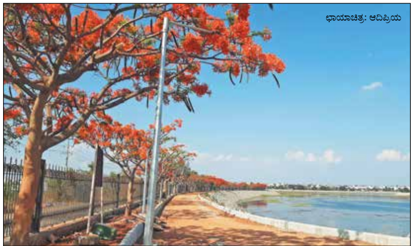
ಕುಂದುವಾಡ ಕೆರೆ ಮೇ ತಿಂಗಳು ಬಂತೆಂದರೆ ಮೇ ಫ್ಲವರ್ ಮೇಳಿಸುವುದು. ಕುಂದುವಾಡ ಕೆರೆಯ ಬಳಿ ಇರುವ ಮೇ ಫ್ಲವರ್ ಸಾಲು ಮರಗಳ ದೃಶ್ಯ.

ನವದೆಹಲಿ, ಮೇ 2 -ಕರ್ನಾಟಕದಲ್ಲಿ ಅಧಿಕಾರಕ್ಕೆ ಬಂದ ಭಜರಂಗ ದಳ ನಿಷೇಧಿಸುವುದಾಗಿ ಕಾಂಗ್ರೆಸ್ ಪಕ್ಷ ಪ್ರಕಾಶಿಸಿತ್ತು. ತಿಳಿಸಿರುವುದು ಬಿಜೆಪಿಯು ತೀವ್ರ ಆಕ್ರೇಷಕ್ಕೆ ಕಾರಣವಾಗಿದೆ. ಕಾಂಗ್ರೆಸ್ ನಿಲುವನ್ನು ಬಿಜೆಪಿ ಸರ್ಕಾರವು ಪ್ರಧಾನ ಮಂತ್ರಿ ಸರೇಂದ್ರ ಮೋದಿ, ಹನುಮಂತ ದೇವರನ್ನು ಬೀಗದೊಳಗೆ ಇರಿಸಲು ಕಾಂಗ್ರೆಸ್ ಯತ್ನಿಸುತ್ತಿದೆ ಎಂದು ಆರೋಪಿಸಿದ್ದಾರೆ. ಕರ್ನಾಟಕದ ಹೊಸಪೇಟೆಯಲ್ಲಿ ಆಯೋಜಿಸಲಾಗಿದ್ದ ಸಮಾವೇಶದಲ್ಲಿ ಮಾತನಾಡಿದ ಪ್ರಧಾನಿ, ಕಾಂಗ್ರೆಸ್ ಪಕ್ಷ ಈ ಹಿಂದೆ ಅಯೋಧ್ಯೆಯ ರಾಮ ಮಂದಿರಕ್ಕೆ ಬೀಗ ಹಾಕಿತ್ತು. ಈಗ ಜೈ ಭಜರಂಗ ಬಲಿ ಎಂದು ಹೇಳುವವರನ್ನು ಬಂಧಿಸಲು ಮುಂದಾಗಿದೆ ಎಂದು ಆರೋಪಿಸಿದರು. ಹನುಮಂತ ದೇವರ ನೆಲಕ್ಕೆ ಬಂದಿರುವುದು