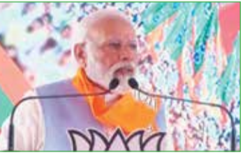
ಕಾಂಗ್ರೆಸ್ ಪಕ್ಷದ ಇತಿಹಾಸ ಹಾಗೂ ಚಿಂತನೆ ಯನ್ನು ರಾಜ್ಯದ ಜನರು ಎಂದೂ ಮರೆಯ

ಚಿತ್ರದುರ್ಗ, ಮೇ 2 - ಕಾಂಗ್ರೆಸ್ ಪಕ್ಷವು ಉಗ್ರವಾದಿ ಹಾಗೂ ಉಗ್ರವಾದಿಗಳ ಓಲೈಕೆಯ ಇತಿಹಾಸ ಹೊಂದಿದೆ ಎಂದು ಪ್ರಧಾನ ಮಂತ್ರಿ ನರೇಂದ್ರ ಮೋದಿ ಆರೋಪಿಸಿದ್ದಾರೆ. ಚಿತ್ರದುರ್ಗದಲ್ಲಿ ಆಯೋಜಿಸಲಾಗಿದ್ದ ಚುನಾವಣಾ ಸಮಾವೇಶದಲ್ಲಿ ಮಾತನಾಡಿದ ಅವರು, ಸರ್ಜೆಟ್ ದಾಳಿ ಹಾಗೂ ವೈಮಾನಿಕ ದಾಳಿಗಳನ್ನು ನಡೆಸಿದಾಗ ಕಾಂಗ್ರೆಸ್ ರಕ್ಷಣಾ ಪಡೆಗಳನ್ನು ಪ್ರಶ್ನಿಸಿದ ಎಂದು ಹೇಳಿದರು.