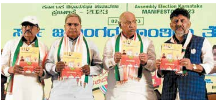
ಹಳೆಯ ಪಿಂಚಣಿ ಯೋಜನೆ ಜಾರಿಗೆ ತರುವುದಾಗಿ ಕಾಂಗ್ರೆಸ್ ಪ್ರಣಾಳಿಕೆಯಲ್ಲಿ ಘೋಷಣೆ

ಬೆಂಗಳೂರು, ಮೇ 2 - ಗೃಹ ಜ್ಯೋತಿ, ಗೃಹಲಕ್ಷ್ಮಿ, ಅಸ್ವಭಾಗ್ಯ, ಯುವ ನಿಧಿ ಮತ್ತು ಎಲ್ಲಾ ಮಹಿಳೆಯರಿಗೆ ಸರ್ಕಾರಿ ಬಸ್‌ಗಳಲ್ಲಿ ಉಚಿತ ಪ್ರಯಾಣದ ಭರವಸೆಗಳನ್ನು ಪ್ರಕಟಿಸಿದ್ದ ಕಾಂಗ್ರೆಸ್, ಮತದಾರರನ್ನು ಓಲೈಯಿಸಿಕೊಳ್ಳಲು ಇಂದಿಲ್ಲಿ ಮತ್ತಷ್ಟು ಭರವಸೆಗಳ ಮಹಾಪೂರವನ್ನೇ ಹರಿಸಿದೆ. 'ಸರ್ವ ಜನಾಂಗದ ಶಾಂತಿಯ ತೋಟ-ಇದುವೇ ಕಾಂಗ್ರೆಸ್ ಬದ್ಧತೆ' ಎಂಬ ಹೆಸರಿನಡಿ ಚುನಾವಣಾ ಪ್ರಣಾಳಿಕೆ ಬಿಡುಗಡೆ ಮಾಡಿರುವ ಕಾಂಗ್ರೆಸ್ ಪಕ್ಷ, ಅಧಿಕಾರಕ್ಕೆ ಬಂದರೆ ಸಮಾಜದ ಸ್ವಾಸ್ಥ್ಯ ಹಾಳು ಮಾಡುತ್ತಿರುವ ಭಜರಂಗದಳ, ಪಿಎಫ್‌ಐ ನಿಷೇಧಿಸುವುದಾಗಿ ಘೋಷಿಸಿದೆ. ಏಕರೂಪ ನಾಗರಿಕ ಸಂಹಿತೆ ಜಾರಿಗೊಳಿಸುವುದಾಗಿ ಬಿಜೆಪಿ ಹೇಳಿದ್ದರೆ, ಸಮಾಜದ ಆರೋಗ್ಯ ಹಾಳು ಮಾಡುವ ಆರೋಗ್ಯ ಸ್ವಾಸ್ಥ್ಯ ಹಾಳು ಮಾಡುವುದಾಗಿ ಕಾಂಗ್ರೆಸ್ ತಿಳಿಸಿದೆ. ರಾಷ್ಟ್ರೀಯ ಕಾಂಗ್ರೆಸ್ ಅಧ್ಯಕ್ಷ ಮಲ್ಲಿಕಾರ್ಜುನ ಖರ್ಗೆ, ರಾಜ್ಯ ಉಸ್ತುವಾರಿ