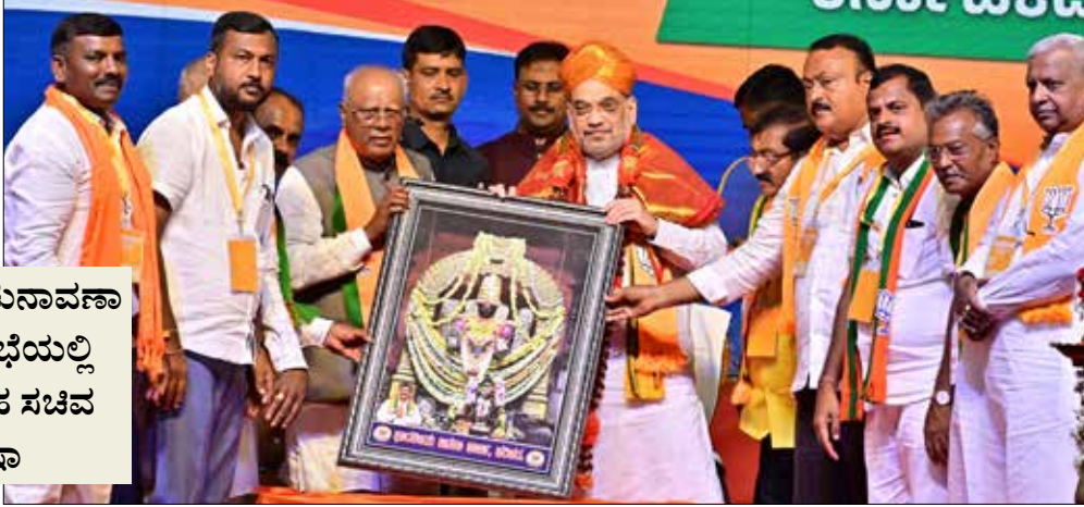
ಹರಿಹರ ಚುನಾವಣಾ ಪ್ರಚಾರ ಸಭೆಯಲ್ಲಿ ಕೇಂದ್ರ ಗೃಹ ಸಚಿವ ಅಮಿತ್ ಷಾ

ಹರಿಹರ, ಏ. 28 - ಕಾಂಗ್ರೆಸ್‌ಗೆ ತಾನು ಅಧಿಕಾರಕ್ಕೆ ಬರುವುದಿಲ್ಲ ಎಂದು ಗೊತ್ತಾಗಿದೆ. ಒಣಗಿ ಆ ಪಕ್ಷ ಏನು ಬೇಕಾದರೂ ಭರವಸೆ ನೀಡಬಹುದು. ಆ ಪಕ್ಷದ ಗ್ಯಾರಂಟಿಗಳಿಗೆ ಯಾವುದೇ ಗೌರವವಿಲ್ಲ, ಮಾಲ್ವವಿಲ್ಲ ಎಂದು ಬಿಜೆಪಿ ನಾಯಕ ಹಾಗೂ ಕೇಂದ್ರ ಗೃಹ ಸಚಿವ ಅಮಿತ್ ಷಾ ಹೇಳಿದರು.