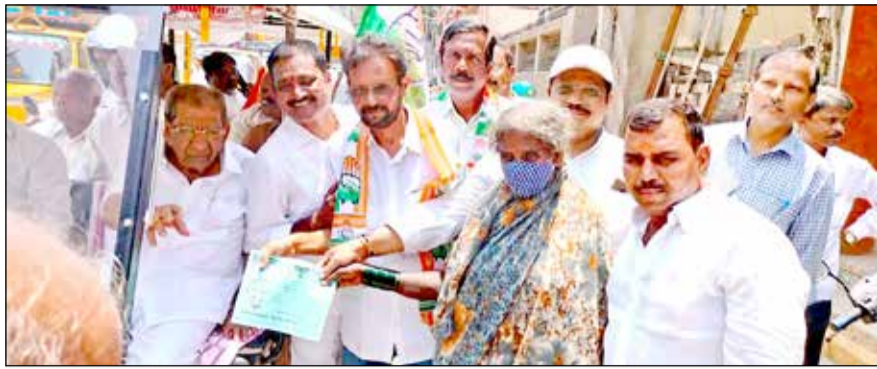
ಹೇಳಿದ ಬಿಜೆಪಿಗಳು ಇಂದು ದೇಶವನ್ನು ಮಾರಾಟಕ್ಕೆ ಇಟ್ಟಿದ್ದಾರೆ. ಸುಳ್ಳುಗಳನ್ನು ಹೇಳಿ ಅಧಿಕಾರಕ್ಕೆ ಬಂದವರು ಜನಸಾಮಾನ್ಯರಿಗೆ ಒತ್ತು ಮಾಡದೆ ಕೇವಲ ಬ್ರಷ್ಟಾಚಾರದಲ್ಲಿ ತೊಡಗಿದ್ದಾರೆ ಎಂದು ದೂರಿದರು. ಈ ಸಂದರ್ಭದಲ್ಲಿ ಮಹಾನಗರ ಪಾಲಿಕೆ ಮಾಜಿ

ಗಾಂಧಿನಗರದ ಸಂವಿಧಾನ ಶಿಲ್ಪಿ ಡಾ|| ಬಿ.ಆರ್. ಅಂಬೇಡ್ಕರ್ ಪ್ರತಿಮೆಗೆ ಮಾಲಾಪೂಜೆ ನಂತರ ಗಡಿಯಾರ ಕೆಲವು ಬಳಿಯ ಶ್ರೀ ಗಣೇಶ ದೇವಸ್ಥಾನದಲ್ಲಿ ಪೂಜೆ ಸಲ್ಲಿಸಿದ ನಂತರ ಶ್ರೀಮತೇಜಿ, ಭಲವಾದಿ ಕೇರಿ ಸೇರಿದಂತೆ ವಿವಿಧ ಭಾಗಗಳಲ್ಲಿ ಎಸ್.ಎಸ್.ಎಸ್ ಮತ ಯಾಜ್ಞವನ್ನು ದೇಶದ ಚಿತ್ರಣವನ್ನೇ ಬದಲಾವಣೆ ಮಾಡುತ್ತೇನೆಂದು