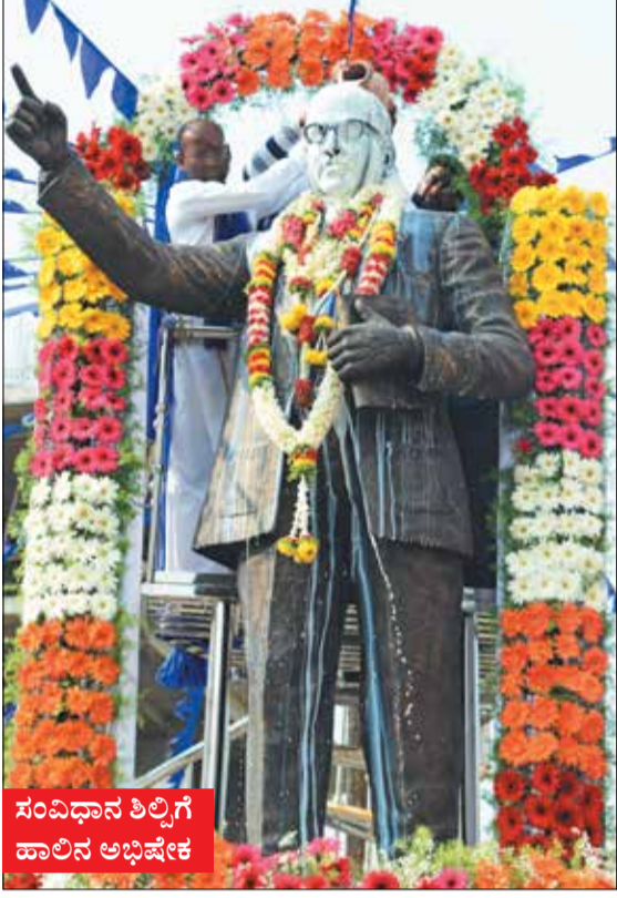
ಸಂವಿಧಾನ ಶಿಲ್ಪಿಗೆ ಹಾಲಿನ ಅಭಿಷೇಕ

ಸಂಪುಟ : 49 ಸಂಚಿಕೆ : 333 ಫೋನ್ : 254736 91642 99999 RNI No: 27369/75 KA/SK/CTA-275/2021-2023. O/P @ B.V. Nagar P.O. ಪುಟ : 6 ರೂ : 5.00 www.janathavani.com janathavani@mac.com