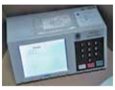
ಮತಯಂತ್ರ ಬಳಕೆ: ಮುಂದುವರೆದ ದೇಶಗಳನ್ನು ಹಿಂಜಿಕ್ಕಿದ ಭಾರತ

ಭಾರತದ ಚುನಾವಣೆ ಪ್ರಮುಖ ಅಂಶಗಳಲ್ಲಿ ಮತಯಂತ್ರ ಸಹ ಒಂದಾಗಿದೆ. ಅಮೆರಿಕ ಸೇರಿದಂತೆ, ಹಲವಾರು ಮುಂದುವರಿದ ದೇಶಗಳು ಈಗಲೂ ಮತಪತ್ರಗಳನ್ನು ಬಳಸುತ್ತಿರುವಾಗ, ಭಾರತ ಮಾತ್ರ ವಿದ್ಯುನ್ಮಾನ ಮತಯಂತ್ರದಲ್ಲಿ ಪ್ರಮುಖ ಹೆಜ್ಜೆ ಇಟ್ಟಿದೆ.