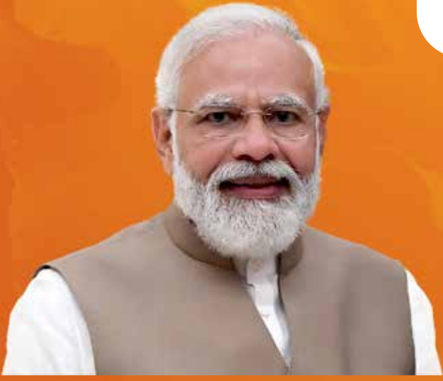
ಶ್ರೀ ನರೇಂದ್ರ ಮೋದಿ ಸನ್ಮಾನ್ಯ ಪ್ರಧಾನಮಂತ್ರಿಗಳು