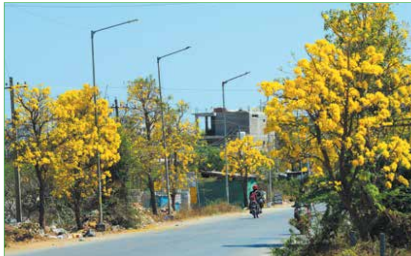
ಹಳದಿ ಹೂಗಳ ಹಾದಿ

ದಾವಣಗೆರೆ, ಮಾ.7 - ಕರ್ನಾಟಕ ನಗರಾಭಿವೃದ್ಧಿ ಪ್ರಾಧಿಕಾರಗಳ ನಿಯಮದ ಪ್ರಕಾರ ಪ್ರಾಧಿಕಾರದ ನಿವೇಶನ ಹಂಚಿಕೆಯಲ್ಲಿ ತಿದ್ದುಪಡಿ ಕೈಗೊಳ್ಳಲಾಗಿದೆ. ಕೇಂದ್ರ ಸಶಸ್ತ್ರ ಪಡೆಯ ಸೇವಾ ನಿರತ ಸೈನಿಕರು, ಮಾಜಿ ಸೈನಿಕರು, ಮೃತ ಮಾಜಿ ಸೈನಿಕರ ಪತ್ನಿ ಮತ್ತು ಸೇವೆಯಲ್ಲಿರುವಾಗ ಮರಣ ಹೊಂದಿರುವ ಯೋಧರ ಅವಲಂಬಿತರಿಗೆ ಶೇ. 5 ರಷ್ಟು ನಗರಾಭಿವೃದ್ಧಿ ಪ್ರಾಧಿಕಾರಗಳ ನಿವೇಶನ ಹಂಚಿಕೆಯಲ್ಲಿ ಮೀಸಲಾತಿ ನೀಡಲಾಗಿದೆ ಎಂದು ಶಿವಮೊಗ್ಗ ಸೈನಿಕ ಕಲ್ಯಾಣ ಮತ್ತು ಪುನರ್ವಸತಿ ಇಲಾಖೆ ಉಪ ನಿರ್ದೇಶಕರು ತಿಳಿಸಿದ್ದಾರೆ.