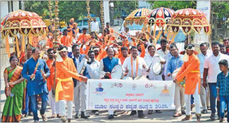
ತರಬೇತುದಾರರ ನೇಮಿಸಿ ಪ್ರತಿ ಜಿಲ್ಲೆಯಲ್ಲೂ ಐದು ಪ್ರಕಾರದ ಕಲೆಗಳಿಗೆ 10 ವಿದ್ಯಾರ್ಥಿಗಳ ಒಂದು ತಂಡ ರಚನೆ ಮಾಡಿ ತರಬೇತಿ ನೀಡಲಾಗಿದೆ. ಒಟ್ಟು ರಾಜ್ಯದ 1800 ಜನ ನೂತನ ಶಿಬಿರಾರ್ಥಿಗಳಿಗೆ 350 ಜನ ಶಿಕ್ಷಕರಿಂದ ತರಬೇತಿ ಕೊಡಿಸಲಾಗಿದೆ ಎಂದು ತಿಳಿಸಿದರು. ಪ್ರಮುಖವಾಗಿ ಮೂವತ್ತು ವರ್ಷದ ಒಳಗಿನ ಯುವಕರನ್ನು ಆಯ್ಕೆ ಮಾಡಿಕೊಂಡು ತರಬೇತಿ ನೀಡಲಾಗಿದೆ. 5 ತಂಡಗಳಲ್ಲಿ ಎರಡು ತಂಡಗಳಿಗೆ ರಾಜ್ಯಮಟ್ಟದ (4ನೇ ಪುಟಕ್ಕೆ)

ದಾವಣಗೆರೆ, ಮಾರ್ಚ್ 3 - ದೇಶದ ಮೂಲ ತಳಪದಿ ಜಾನಪದ ಸಂಸ್ಕೃತಿಯಲ್ಲಿದ್ದು, ನಶಿಸುತ್ತಿರುವ ತಳಸಮುದಾಯಗಳ ಜಾನಪದ ಕಲೆಗಳಿಗೆ ಪುನರ್ಜೀವನ ನೀಡುವ ಉದ್ದೇಶದಿಂದ ಯೋಜನೆ ಜಾರಿಗೊಳಿಸಲಾಗಿದೆ ಎಂದು ಮೂಲ ಸಂಸ್ಕೃತಿ-ಕನ್ನಡ ಸಂಸ್ಕೃತಿ ಯೋಜನೆಯ ರಾಜ್ಯ ಸಂಚಾಲಕ ಜಗದೀಶ್ ಹಿರೇಮನಿ ಹೇಳಿದರು. ಶುಕ್ರವಾರ ಜಿಲ್ಲಾಧಿಕಾರಿ ಭವನದ ತುಂಗಭದ್ರಾ ಸಭಾಂಗಣದಲ್ಲಿ ಜಿಲ್ಲಾಧಿಕಾರಿ, ಜಿಲ್ಲಾ ಪಂಚಾಯತ್ ಹಾಗೂ ಕನ್ನಡ ಮತ್ತು ಸಂಸ್ಕೃತಿ ಇಲಾಖೆ ಸಂಯುಕ್ತವಾಗಿ ಕನ್ನಡ ಮತ್ತು ಸಂಸ್ಕೃತಿ ಮೂಲ ಸಂಸ್ಕೃತಿ, ಕನ್ನಡ ಸಂಸ್ಕೃತಿ ಕಾರ್ಯಕ್ರಮ ಉದ್ಘಾಟಿಸಿ ಅವರು ಮಾತನಾಡಿದರು. ಸಾವಿರಾರು ವರ್ಷಗಳ ಭಾರತದ ಇತಿಹಾಸದಲ್ಲಿ ಮೊದಲ ಸ್ಥಾನದಲ್ಲಿದ್ದು ಜಾನಪದ ಸಂಸ್ಕೃತಿ ಈ ಸಂಸ್ಕೃತಿಯ ಅಧಾರದ ಮೇಲೆ ಭಾರತೀಯರ ಜೀವನ ಪದ್ಧತಿ ನಡೆದು ಬಂದಿದೆ. ಕಾಲಕ್ರಮೇಣ ನಶಿಸಿ ಹೋಗುತ್ತಿರುವ ತಳಸಮುದಾಯಗಳ ವಿಶಿಷ್ಟ ಕಲೆ ಮತ್ತು ಕಲಾ ಪ್ರಕಾರಗಳ ಪುನರ್ಜೀವನ ಮಾಡುವುದಕ್ಕಾಗಿ ಕಾರ್ಯಕ್ರಮ ಆಯೋಜಿಸಲಾಗಿದೆ ಎಂದು. ರಾಜ್ಯದ 31 ಜಿಲ್ಲೆಗಳಲ್ಲಿ ನಶಿಸಿ ಹೋದ ಕಲೆಗಳನ್ನು ಹುಡುಕಿ, ಸಂಬಂಧಪಟ್ಟ ಕಲೆಗಳಿಗೆ ತರಬೇತಿ ನೀಡಲು