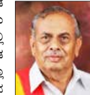
3ನೇ ವಿಶ್ವ ಕನ್ನಡ ಸಮ್ಮೇಳನವನ್ನು ಆಯೋಜಿಸಲು ದಾವಣಗೆರೆ ಜಿಲ್ಲಾ ತುದಿಗಾಲಿನಲ್ಲಿ ನಿಂತಿದೆ. ಈಗಾಗಲೇ ವಿಶ್ವ ಕನ್ನಡ ಸಮ್ಮೇಳನದ ಕುರಿತಾಗಿ ಜಿಲ್ಲಾ ಕನ್ನಡ ಸಾಹಿತ್ಯ ಪರಿಷತ್ತಿನ ವತಿಯಿಂದ ಸುಮಾರು 1500 ಪುಟಗಳ ಕ್ರಿಯಾ ಯೋಜನೆಯನ್ನು ಸಿದ್ಧಪಡಿಸಿ ಸರ್ಕಾರಕ್ಕೆ ಹಾಗೂ ಕನ್ನಡ ಮತ್ತು ಸಂಸ್ಕೃತಿ ಇಲಾಖೆಗೆ ಸಲ್ಲಿಸಿಯಾಗಿದೆ. 4-5 ವರ್ಷಗಳ ಹಿಂದೆಯೇ ಈ ಸಮ್ಮೇಳನ ದಾವಣಗೆರೆಯಲ್ಲಿ ನಡೆಯಬೇಕೆತ್ತು. ಆದರೆ ಅನಿವಾರ್ಯ ಕಾರಣಗಳಿಂದಾಗಿ ಅದು ಮುಂದೂಡಲಾಯಿತು. ನಂತರ 2021 ನವೆಂಬರ್ ನಲ್ಲಿ ಹೇರಿದ್ದರು. ತಮ್ಮ ಚುನಾವಣಾ ಪ್ರಣಾಳಿಕೆಯಲ್ಲಿಯೂ ಅವು ಗೆದ್ದರೆ ವಿಶ್ವಕನ್ನಡ ಸಮ್ಮೇಳನವನ್ನು ದಾವಣಗೆರೆಯಲ್ಲಿ ನಡೆಸಲು ಪ್ರಯತ್ನಿಸುವುದಾಗಿ ಘೋಷಿಸಿದ್ದರು. ಕಳೆದ ವರ್ಷ ಎಲೆಕ್ಷನ್‌ನಲ್ಲಿ ನಡೆದ 11 ನೇ ದಾವಣಗೆರೆ ಜಿಲ್ಲಾ ಕನ್ನಡ ಸಾಹಿತ್ಯ ಸಮ್ಮೇಳನದಲ್ಲೂ ವಿಶ್ವ ಕನ್ನಡ ಸಮ್ಮೇಳನವನ್ನು ದಾವಣಗೆರೆಯಲ್ಲಿ ಆಯೋಜಿಸಬೇಕೆಂದು ಎನ್ನುವ ನಿರ್ಣಯವನ್ನು ಕೈಗೊಂಡು ಸರ್ಕಾರಕ್ಕೆ ಮನವಿ ಮಾಡಲಾಗಿತ್ತು. ಇತ್ತೀಚೆಗೆ ಈ ಬಾರಿಯ ಬಜೆಟ್‌ನಲ್ಲಿ ವಿಶ್ವ ಕನ್ನಡ ಸಮ್ಮೇಳನವನ್ನು ದಾವಣಗೆರೆಯಲ್ಲಿ ಆಯೋಜಿಸುವ ಬಗ್ಗೆ ಪ್ರಸ್ತಾವಿಸಬೇಕೆಂದು ಹಾಗೂ ಅನುದಾನವನ್ನು ವೀಸಲಿಸಬೇಕೆಂದು ಎಂದು ಮುಖ್ಯಮಂತ್ರಿಗಳಿಗೆ ಪತ್ರವನ್ನೂ ಬರೆದು ಆಗ್ರಹಿಸಿದ್ದರು. ಕಳೆದ ತಿಂಗಳು ಜನವರಿಯಲ್ಲಿ ಹಾವೇರಿಯಲ್ಲಿ ನಡೆದ 86 ನೇ ಅಖಿಲ ಭಾರತ ಕನ್ನಡ ಸಾಹಿತ್ಯ ಸಮ್ಮೇಳನದಲ್ಲೂ ದಾವಣಗೆರೆಯಲ್ಲಿಯೇ ವಿಶ್ವ ಕನ್ನಡ ಸಮ್ಮೇಳನ ನಡೆಯಬೇಕೆಂದು ನಿರ್ಣಯ ಮಂಡಿಸಿ ಸರ್ಕಾರಕ್ಕೆ ಒತ್ತಡ ಹೇರಿದ್ದರು.