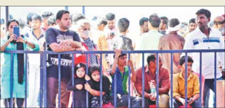
ಕುತೂಹಲದಿಂದ ಶ್ವಾನ ಪ್ರದರ್ಶನ ವೀಕ್ಷಿಸುತ್ತಿರುವ ಮಕ್ಕಳು, ಪೋಷಕರು ಸೇರಿ ಹಿಡಿಯುತ್ತಿದ್ದರು. ಚಿಕ್ಕ ಮಕ್ಕಳು ಮುದ್ದಿನ ಸಾವಾನ್ನವಾಗಿತ್ತು. ಕೆಲವರು ತಮಗೆ ಇಷ್ಟವಾದ ಶ್ವಾನಗಳೊಂದಿಗೆ ಸೆಲ್ಫಿ ತೆಗೆಸಿಕೊಳ್ಳುತ್ತಿದ್ದರು

ತಾವು ಸಹ ಯಾರಿಗೂ ಕಡಿಮೆ ಇಲ್ಲ ಎಂಬಂತೆ ಪ್ರದರ್ಶನದಲ್ಲಿ ಶ್ವಾನಗಳು ಹೆಚ್ಚೆ ಹಾಕಿದವು. ಮಾಲೀಕರ ಮಾತುಗಳನ್ನು ಕೇಳುವ ಮೂಲಕ ಪ್ರೇಕ್ಷಕರನ್ನು ರಂಜಿಸಿದವು. ನಡಿಗೆ, ಮಾಲೀಕರ ಮಾತು ಕೇಳುವ ಬಗ್ಗೆ, ಆರೋಗ್ಯ ಪರೀಕ್ಷಿಸಿ ಅಪ್ಪಳಿಸುವಂತೆ ತೀರ್ಪು ನೀಡುತ್ತಿದ್ದರು. ಶ್ವಾನಗಳ ಮುದ್ದಾದ ಹಾಗೂ ಗಾಂಧೀಯನ ನಡಿಗೆಯನ್ನು ಪ್ರಾಣಿ ಪ್ರಿಯರು ಮೊಜೆಲ್ ಗಳಲ್ಲಿ