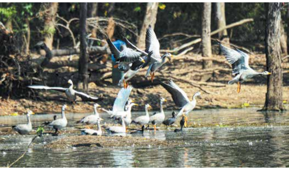
ಕೊಂಡಜ್ಜಿ ಕೆರೆಯಲ್ಲಿ ಪಟ್ಟಿ ತಲೆ ಹೆಬ್ಬಾತುಗಳು

ಸಂಪುಟ : 49 ಸಂಚಿಕೆ : 262 ಫೋನ್ : 254736 91642 99999 RNI No: 27369/75 KA/SK/CTA-275/2021-2023. O/P @ B.V. Nagar P.O. ಪುಟ : 6 ರೂ : 5.00 www.janathavani.com janathavani@mac.com