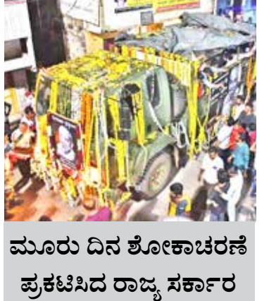
ಮೂರು ದಿನ ಶೋಕಾಚರಣೆ ಪ್ರಕಟಿಸಿದ ರಾಜ್ಯ ಸರ್ಕಾರ

ಬೆಂಗಳೂರು, ಸೆ. 7 - ನಿನ್ನೆ ಹೃದಯಾಘಾತದಿಂದ ನಿಧನರಾದ ಸಚಿವ ಉಮೇಶ್ ಕತ್ತಿ ಅವರ ಅಂತ್ಯಕ್ರಿಯೆಯನ್ನು ಸಕಲ ಸರ್ಕಾರಿ ಗೌರವಗಳೊಂದಿಗೆ ಬುಧವಾರ ನೆರವೇರಿಸಲಾಯಿತು. ರಾಜ್ಯ ಸರ್ಕಾರವು ಸೆಪ್ಟೆಂಬರ್ 9ರವರೆಗೆ ರಾಜ್ಯಾದ್ಯಂತ ಶೋಕಾಚರಣೆ ಪ್ರಕಟಿಸಿದೆ. 61 ವರ್ಷದ ಸಚಿವ ಕತ್ತಿ ಅವರ ಅಂತ್ಯಕ್ರಿಯೆಯನ್ನು ಬೆಳಗಾವಿ ಜಿಲ್ಲೆಯ ಹುಕ್ಕೇರಿ ತಾಲ್ಲೂಕಿನಲ್ಲಿರುವ ಅವರ ತವರೂರಾದ ಬೆಲ್ಲದಬಾಗೇವಾಡಿಯಲ್ಲಿ ವೀರಶೈವ - ಲಿಂಗಾಯತ ಸಂಪ್ರದಾಯದ ಅನುಯ ಅಂತ್ಯಕ್ರಿಯೆ ನೆರವೇರಿಸಲಾಯಿತು. ಮೃತರ ಗೌರವಾರ್ಥ ಬೆಳಗಾವಿಯ ಎಲ್ಲಾ ಶಾಲಾ - ಕಾಲೇಜುಗಳು ಹಾಗೂ ಸರ್ಕಾರಿ ಕಚೇರಿಗಳಿಗೆ ರಾಜ್ಯ ಸರ್ಕಾರ ರಚಿ ಘೋಷಿಸಿತ್ತು. ಕತ್ತಿ ಅವರು ಎಂಟು ಬಾರಿ ಹುಕ್ಕೇರಿ ವಿಧಾನಸಭಾ ಕ್ಷೇತ್ರದಿಂದ ಶಾಸಕರಾಗಿದ್ದರು. ಹೃದಯಾಘಾತದಿಂದ ನಿನ್ನೆ ಬೆಂಗಳೂರಿನ ಖಾಸಗಿ ಆಸ್ಪತ್ರೆಯಲ್ಲಿ ನಿಧನರಾಗಿದ್ದ ಕತ್ತಿ, ಪತ್ನಿ ಓರ್ವ ಪುತ್ರ ಹಾಗೂ ಓರ್ವ ಪುತ್ರಿಯನ್ನು ಆಗಲಿದ್ದಾರೆ. ಇದಕ್ಕೂ ಮುಂಚೆ ವಿವಾನದ ಮೂಲಕ ಅವರ ಕಳೆಬರವನ್ನು ಬೆಳಗಾವಿಗೆ ತರಲಾಯಿತು. ನಂತರ ಸೈನಿಕ ವಾಹನದಲ್ಲಿ ಬೆಲ್ಲದಬಾಗೇವಾಡಿಗೆ ತರಲಾಯಿತು. ಸಂಜೆ ಪಾರ್ಥಿವ ಶರೀರದ ಅಂತ್ಯಕ್ರಿಯೆ ನೆರವೇರಿತು. ಮುಖ್ಯಮಂತ್ರಿ ಬಸವರಾಜ ಬೊಮ್ಮಾಯಿ, ಮಾಜಿ ಮುಖ್ಯಮಂತ್ರಿಗಳಾದ ಬಿ.ಎಸ್. ಯಡಿಯೂರಪ್ಪ ಹಾಗೂ ಸಿದ್ದರಾಮಯ್ಯ, ಬೊಮ್ಮಾಯಿ ಸಂಪ್ರದಾಯ ಸಹೋದ್ಯೋಗಿಗಳು, ಶಾಸಕರು ಹಾಗೂ ಬಿಜೆಪಿ ಮುಖಂಡರು ಅಂತ್ಯಕ್ರಿಯೆ ಸಂದರ್ಭದಲ್ಲಿ ಉಪಸ್ಥಿತರಿದ್ದರು. ಸರ್ಕಾರ ಈ ಹಿಂದೆ ರಾಜ್ಯಾದ್ಯಂತ ಒಂದು ದಿನದ ಶೋಕಾಚರಣೆ ಪ್ರಕಟಿಸಿತ್ತು. ನಂತರ ಅದನ್ನು ಸೆಪ್ಟೆಂಬರ್ 9ರವರೆಗೆ ವಿಸ್ತರಿಸಲಾಗಿದೆ.