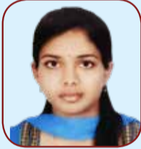
ಅಕ್ಕಿ ಆರ್. Assistant Director