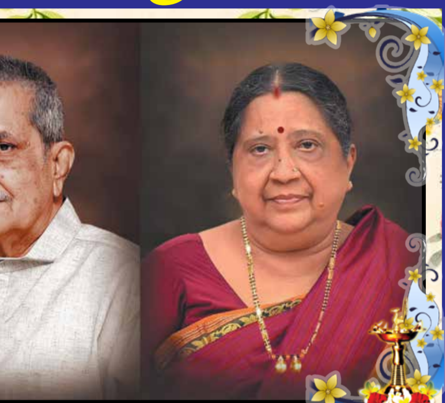
ಉಸಿರು ಹೋದರೂ ಹೆಸರು ಉಳಿಸಿದ ಉಸಿರು ಹೋದರೂ ಹೆಸರು ಉಳಿಸಿದ