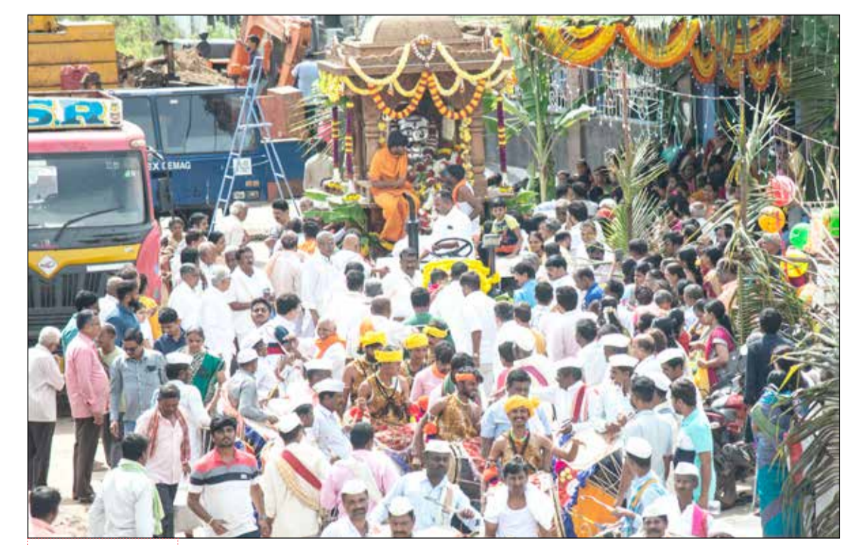
ವಿಜೃಂಭಣೆಯ ಶ್ರೀ ಲಿಂಗೇಶ್ವರ ಸ್ವಾಮಿ ರಥೋತ್ಸವ

ಅಕ್ಟೋಬರ್ 19ರಂದು ಚುನಾವಣೆಯ ಫಲಿತಾಂಶ ಪ್ರಕಟವಾಗಲಿದೆ. ಅಖಿಲೇಂದ್ರ ಅಯ್ಯ ನಡೆದಲ್ಲಿ ಅಕ್ಟೋಬರ್ 8ರಂದು ಅಧ್ಯಕ್ಷರ ಘೋಷಣೆಯಾಗಲಿದೆ ಎಂದು ಪಕ್ಷದ ಕೇಂದ್ರ ಚುನಾವಣಾ ಪ್ರಾಧಿಕಾರದ ಅಧ್ಯಕ್ಷ ಮಧುಸೂದನ್ ಮಿಸ್ರಿ ಹೇಳಿದ್ದಾರೆ. ಕಾಂಗ್ರೆಸ್ ಕಾರ್ಯಕಾರಿ ಸಮಿತಿಯ ಸಭೆಯ ನಂತರ ಈ ಬಗ್ಗೆ ಹೇಳಿಕೆ ನೀಡಲಾಗಿದೆ. ಈ ಹಿಂದೆ ನವೆಂಬರ್ 2000ದಲ್ಲಿ ಕಾಂಗ್ರೆಸ್ ಅಧ್ಯಕ್ಷ ಸ್ಥಾನಕ್ಕೆ ಚುನಾವಣೆ ನಡೆದಿತ್ತು. 1998ರ ನಂತರ ಸೋನಿಯಾ ಗಾಂಧಿ ಅವರು ಪಕ್ಷದ ಸುರಕ್ಷಣೆ ಕಾಲದ (2ನೇ ಪುಟಕ್ಕೆ)