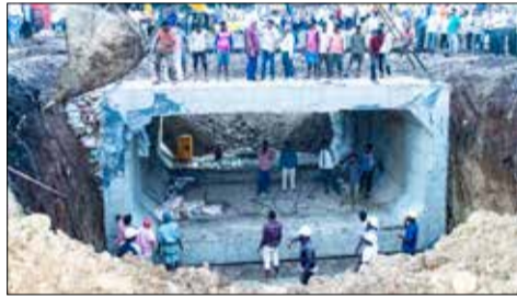
9.30ರ ಸಮಯದಲ್ಲಿ ಆರಂಭವಾದ ಕಾಮಗಾರಿ, ರಾತ್ರಿ 9 ಗಂಟೆಯ ವೇಳೆಗೆ ಪೂರ್ಣಗೊಂಡಿತು.

ದಾವಣಗೆರೆ, ಆ. 28 - ಹಲವು ದಶಕಗಳ ಸಮಸ್ಯೆಯಾಗಿದ್ದ ಅಶೋಕ ರಸ್ತೆಯ ರೈಲ್ವೆ ಕ್ರಾಸ್‌ಗೆ ಸಮಸ್ಯೆ ಬಗೆಹರಿಸುವ ಉದ್ದೇಶದಿಂದ ನಿರ್ಮಿಸಲಾಗುತ್ತಿರುವ ಅಂಡರ್‌ಪಾಸ್‌ಗೆ ಭಾನುವಾರದಂದು ಕಾಂಕ್ರೀಟ್ ಚೌಕಟ್ಟುಗಳನ್ನು ಅಳವಡಿಸುವ ಕಾರ್ಯ ಪೂರ್ಣಗೊಳಿಸಲಾಯಿತು.