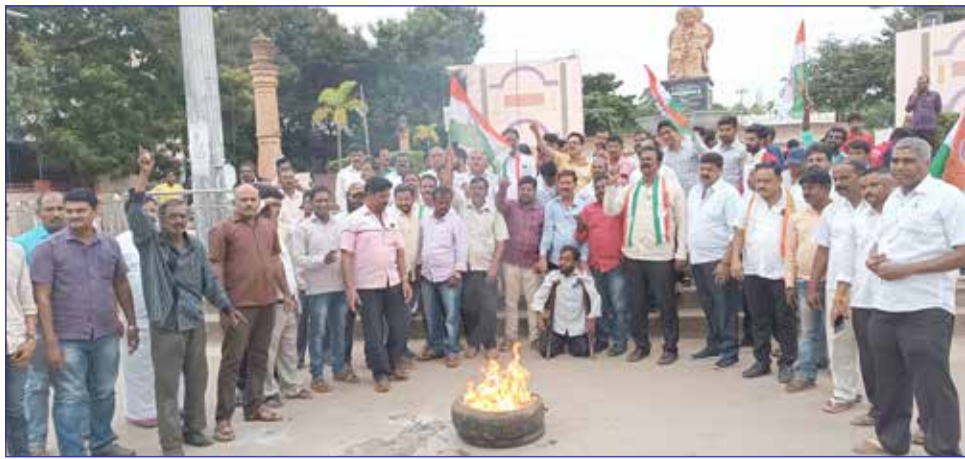
ಜಿಲ್ಲಾ ಕಾಂಗ್ರೆಸ್, ಸಿದ್ದರಾಮಯ್ಯ ಅಭಿಮಾನಿಗಳ ಪ್ರತಿಭಟನೆ

ದಾವಣಗೆರೆ, ಆ.18- ಕೊಡಗಿನಲ್ಲಿ ಮಾಜಿ ಸಿಎಂ ಸಿದ್ದರಾಮಯ್ಯ ಅವರ ಕಾರಿನ ಮೇಲೆ ಮೊಟ್ಟೆ ಎಸೆಯುವ ಪ್ರಯತ್ನ ವಿರೋಧಿಸಿ ಜಿಲ್ಲಾ ಕಾಂಗ್ರೆಸ್‌ನಿಂದ ನಗರದಲ್ಲಿ ಇಂದು ಸಂಜೆ ಪ್ರತಿಭಟನೆ ನಡೆಸಿದರು. ಜಯದೇವ ವೃತ್ತದಲ್ಲಿ ಜಮಾಯಿಸಿದ್ದ ಕಾಂಗ್ರೆಸ್ ಮುಖಂಡರು, ಕಾರ್ಯಕರ್ತರು ಹಾಗೂ ಸಿದ್ದರಾಮಯ್ಯರ ಅಭಿಮಾನಿಗಳು ಟೈಲರ್‌ಗಳಿಗೆ ಬೆಂಕಿ ಹಚ್ಚಿ ಸಿದ್ದರಾಮಯ್ಯ ಅವರ ಕಾರಿನ ಮೇಲೆ ಮೊಟ್ಟೆ ಎಸೆದ ಬಿಜೆಪಿ ಕಾರ್ಯಕರ್ತರು, ಸರ್ಕಾರದ ವಿರುದ್ಧ ಆಕ್ರೋಶ ವ್ಯಕ್ತಪಡಿಸಿದರು. ಸಿದ್ದರಾಮಯ್ಯರ ಕಾರಿನ ಮೇಲೆ ಮೊಟ್ಟೆ ಎಸೆಯಲು ಬಿಜೆಪಿಯವರಿಗಷ್ಟೇ ಅಲ್ಲ, ನಮ್ಮೂರು ಬರುತ್ತೆ, ನಾವು ಸಹ ಮೊಟ್ಟೆ ಸೇರಿದಂತೆ ಬೇರೆ ಬೇರೆ ವಸ್ತುಗಳನ್ನು ಬಿಜೆಪಿ ನಾಯಕರ ಮೇಲೆ ಎಸೆಯಬೇಕಾಗುತ್ತದೆ. ಸಚಿವರು ಬಂದಾಗ ನಾವೂ ಸಹ ಪ್ರತಿಭಟನೆ ನಡೆಸಬೇಕಾಗುತ್ತದೆ. ಬಿಜೆಪಿ ಭ್ರಷ್ಟ ಸರ್ಕಾರ