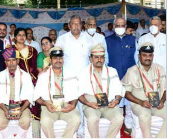
ಜಿಲ್ಲಾ ಕ್ರೀಡಾಂಗಣದಲ್ಲಿ ಆಯೋಜಿಸಲಾಗಿದ್ದ ಸ್ವಾತಂತ್ರ್ಯೋತ್ಸವ ಕಾರ್ಯಕ್ರಮದಲ್ಲಿ ವಿವಿಧ ಶಾಲೆಯ ಮಕ್ಕಳು ನೃತ್ಯ ರೂಪಕ ಪ್ರದರ್ಶಿಸಿದರು. ಪೊಲೀಸ್ ಠಾನ್ ದಳದಿಂದ ಪ್ರದರ್ಶನ ನೆರವೇರಿತು. ಇದೇ ಸಂದರ್ಭದಲ್ಲಿ ಸ್ವಾತಂತ್ರ್ಯ ಹೋರಾಟಗಾರರನ್ನು, ಪೊಲೀಸ್ ಅಧಿಕಾರಿಗಳನ್ನು ಸನ್ಮಾನಿಸಲಾಯಿತು.