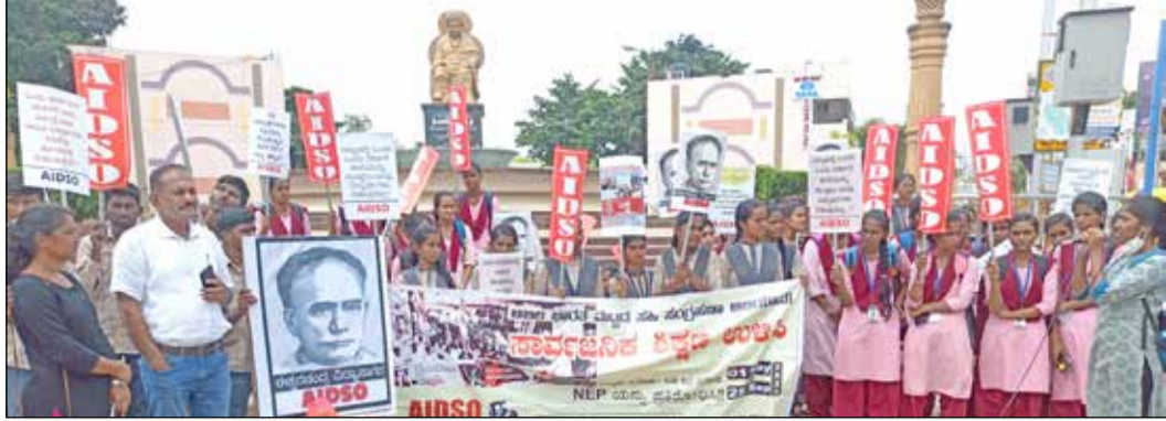
ಎಐಡಿಎಸ್‌ಟಿ ನೇತೃತ್ವದಲ್ಲಿ ವಿದ್ಯಾರ್ಥಿಗಳಿಂದ ನಗರದಲ್ಲಿ ಪ್ರತಿಭಟನೆ