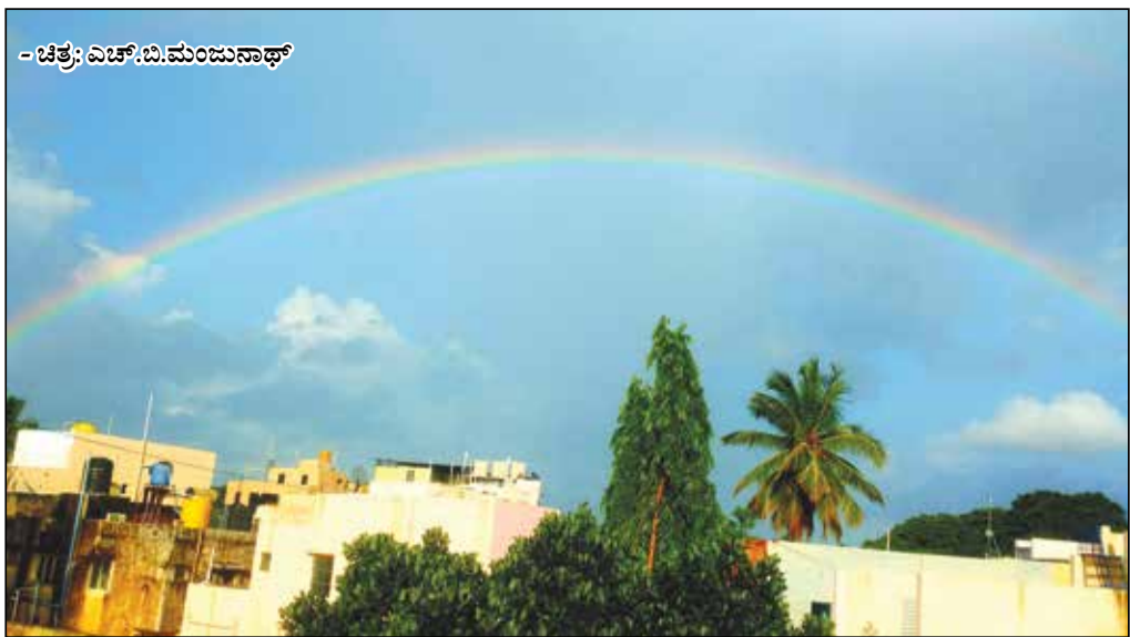
ಬುಧವಾರ ಸಂಜೆ ದಾವಣಗೆರೆಯಲ್ಲಿ ಬಿಸಿಲು - ಮಳೆ ಬಿದ್ದಾಗ ಆಕಾಶದಲ್ಲಿ ಮೂಡಿದ ಸುಂದರ ಕಾಮನಬಿಲ್ಲು. 'ಕಾಮನಬಿಲ್ಲು ಕಮಾನು ಕಟ್ಟಿದ ಮೋಡದ ನಾಡಿನ ಬಾಗಿಲಿಗೆ, ಬಣ್ಣಗಳೇನು ತೋರಣ ಮಾಡಿದೆ ಕಂದನ ಕಣ್ಣಿಗೆ ಹಬ್ಬವ ತಂದಿದೆ'...