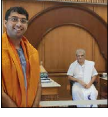
ಧರ್ಮಸ್ಥಳದ ಧರ್ಮಾಧಿಕಾರಿ ಡಾ. ವೀರೇಂದ್ರ ಹೆಗ್ಡೆ ಅಭಿನಂದಿಸಿದರು.